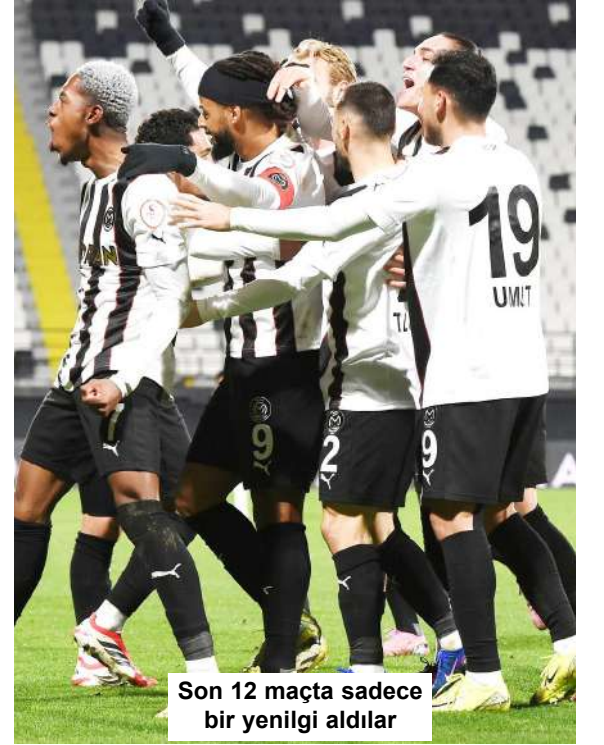
Son 12 maçta sadece bir yenilgi aldılar