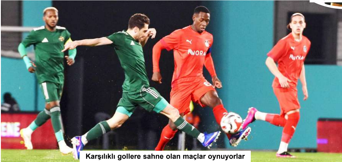
Karşılıklı gollere sahne olan maçlar oynuyorlar