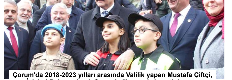
Çorum'da 2018-2023 yılları arasında Valilik yapan Mustafa Çiftçi, İçişleri Bakanı olarak Çorum'a ilk resmi ziyaretini yaptı.