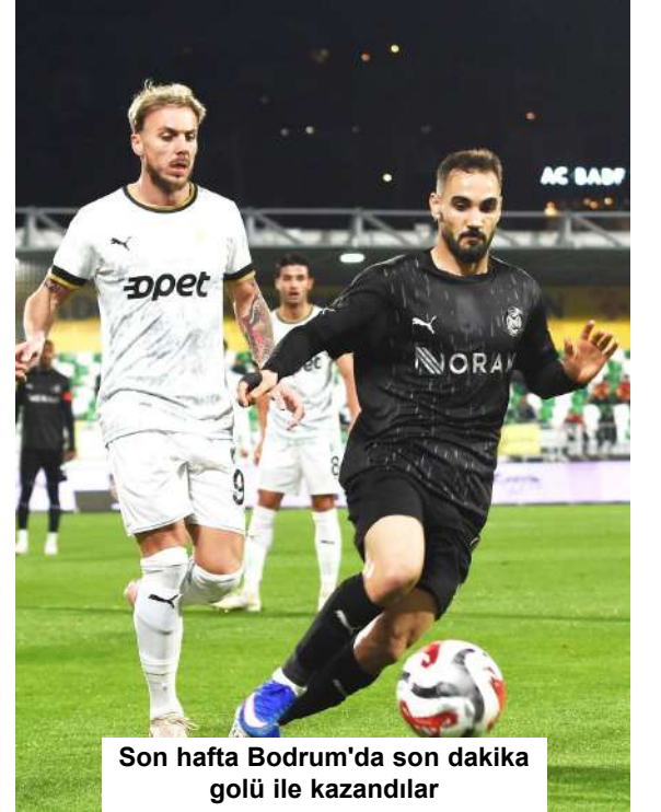
Son hafta Bodrum'da son dakika golü ile kazandılar