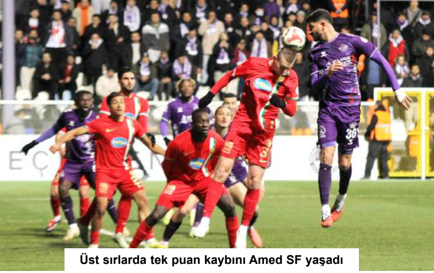
Üst sıralarda tek puan kaybını Amed SF yaşadı