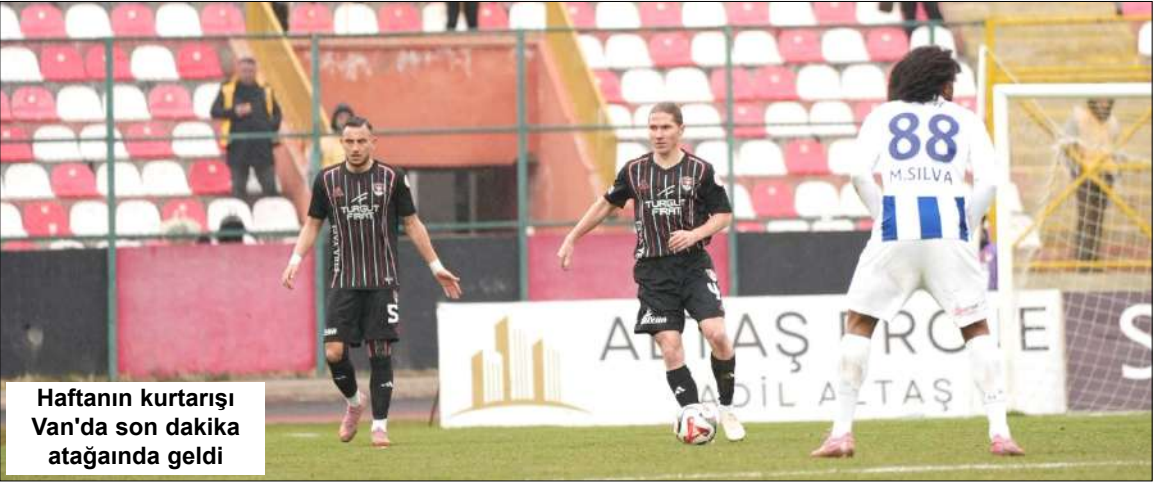
Haftanın kurtarışı Van'da son dakika atağında geldi