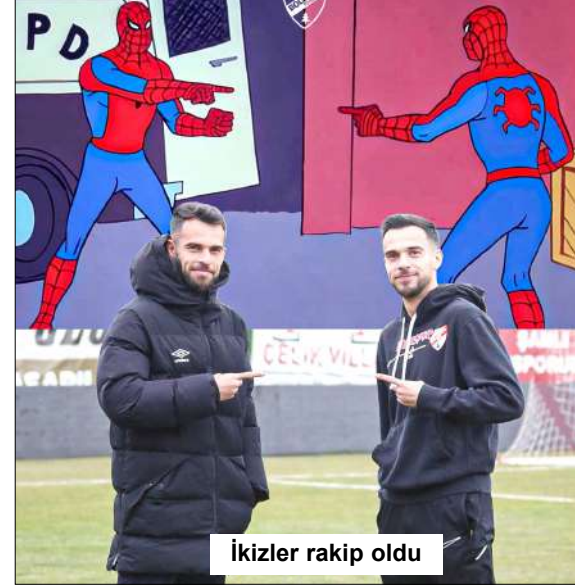
İkizler rakip oldu