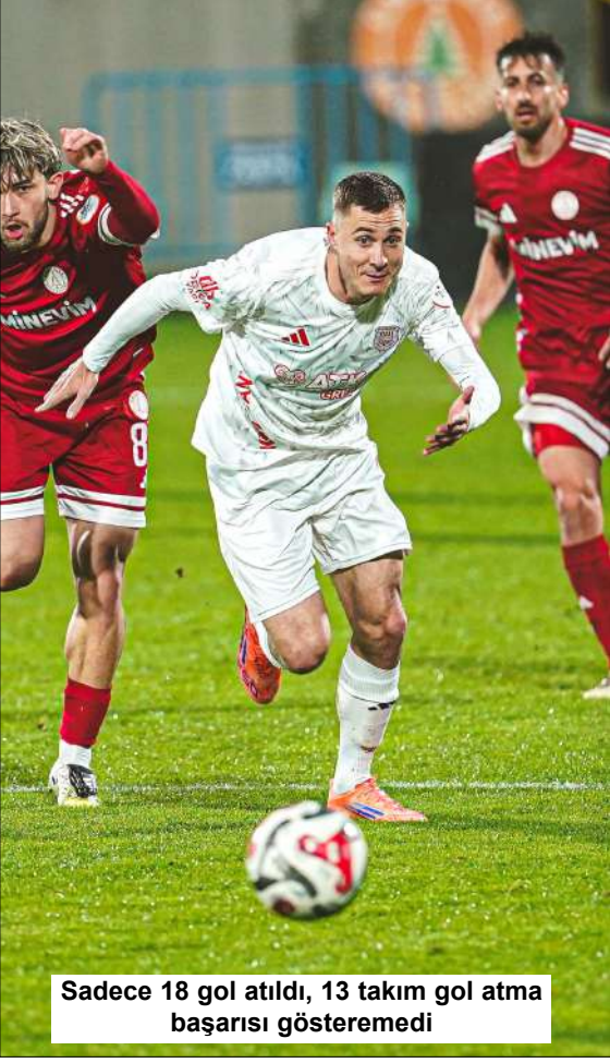
Sadece 18 gol atıldı, 13 takım gol atma başarısı gösteremedi