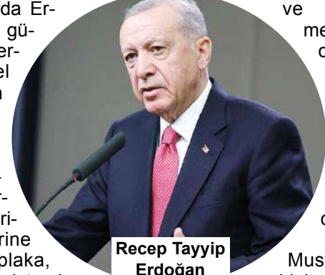
Recep Tayyip Erdoğan

İçişleri Bakanı Mustafa Çiftçi, araç sahiplerine uyarıda bulunarak sonradan taktırılan ekran ve ses sistemlerinin sökülmesi, araçların kanuna uygun hale getirilmesi gerektiğini söyledi. Araçlardaki ekranların orijinal olması halinde sorun olmadığını belirten Çiftçi, bu sistemlerin müzik ve navigasyon gibi amaçlarla kullanılabilirliğini ifade etti. Yeni düzenlemeye göre, çevreyi rahatsız edecek şekilde müzik dinleyen sürücülere 3 bin lira idari para cezası uygulanacak. (Haber Merkezi)