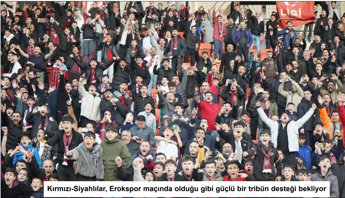
Kırmızı-Siyahlılar, Erokspor maçında olduğu gibi güçlü bir tribün desteği bekliyor