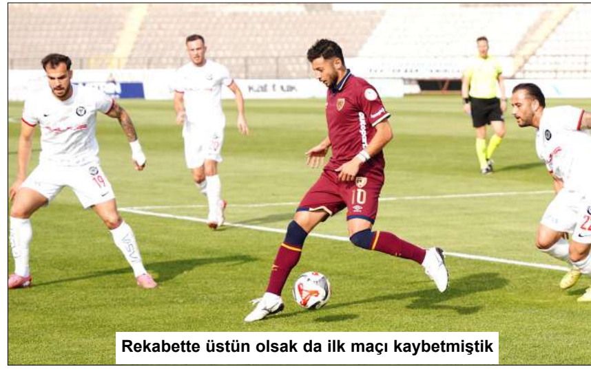
Rekabette üstün olsak da ilk maçı kaybetmiştik

Bugüne kadar oynanan biri kupa maçı olmak üzere altı resmi randevuda Arca Çorum FK'nin iki, Bandırmaspor'un ise bir galibiyeti bulunurken üç karşılaşma eşitlikle sona erdi. (Abdulkadir Söylemez)