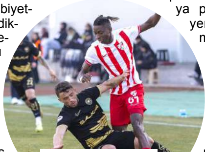
Kırmızı-Siyahlılar seriyi 8 maça çıkartmak istiyor

Ligde topladığı 62 puanla dördüncü sırada yer alan ve sergilediği 19 galibiyetlik performansla dikkatleri üzerine çeken kırmızı siyahlı temsilcimiz, taraftarının da desteğiyle sahadan üç puanla ayrılarak üçüncülük koltuğuna göz dikti. Erokspor'un Sivas deplasmanında puan kaybetmesi durumunda ligin üçüncü basamağına yerleşme şansı bulunana temsilcimizde herhangi bir eksik bulunmazken teknik direktör Uğur Uçar'ın sahaya ideal kadrosuyla çıkması bekleniyor.