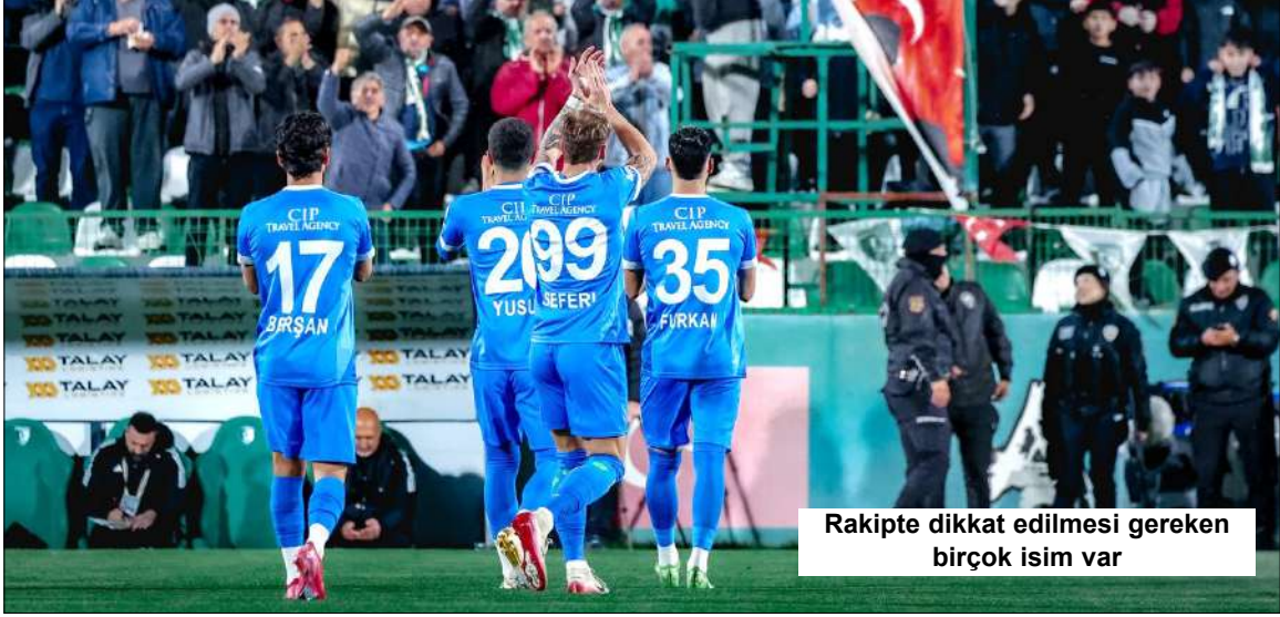
Rakipte dikkat edilmesi gereken birçok isim var