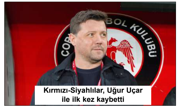
Kırmızı-Siyahlılar, Uğur Uçar ile ilk kez kaybetti