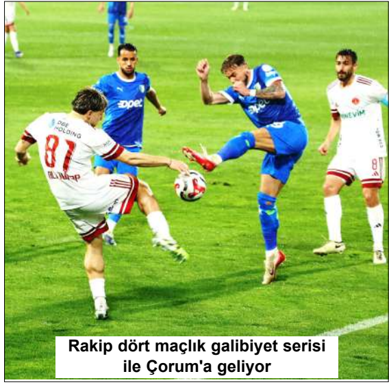
Rakip dört maçlık galibiyet serisi ile Çorum'a geliyor