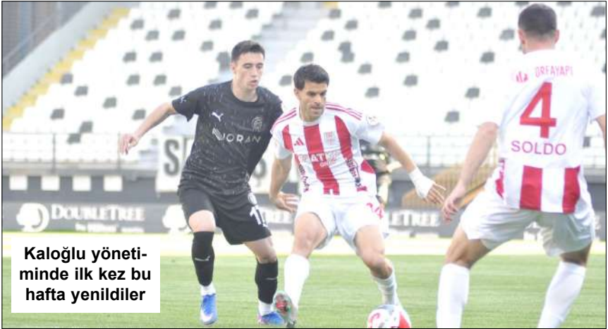
Kaloğlu yönetiminde ilk kez bu hafta yenildiler