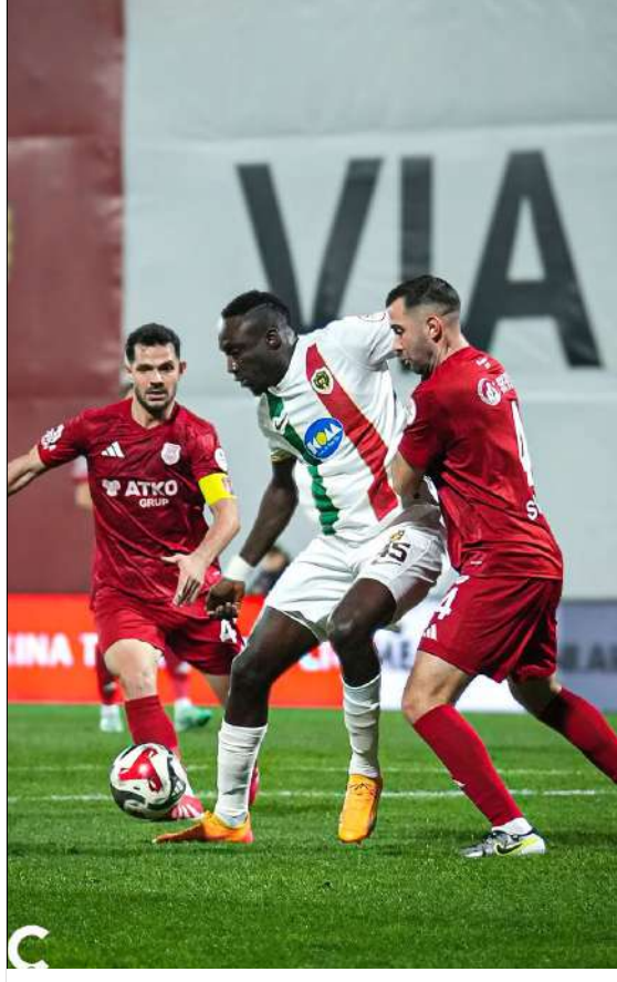
İki teknik adamın karşı karşıya geldiği maçtan bir pozisyon