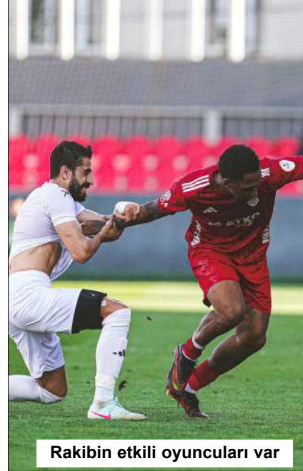
Rakibin etkili oyuncuları var