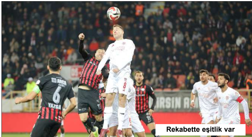
Rekabette eşitlik var