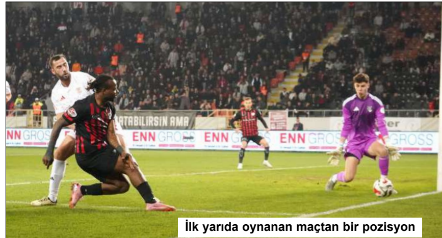
İlk yarıda oynanan maçtan bir pozisyon