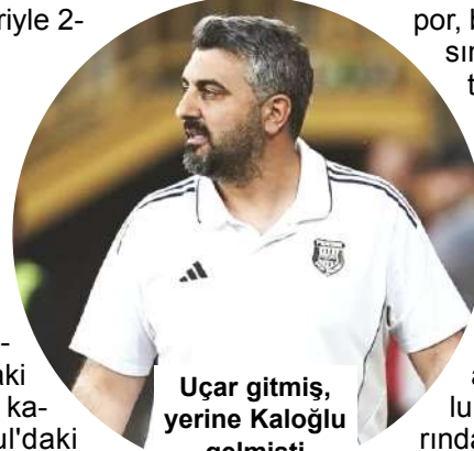
Uçar gitmiş, yerine Kaloğlu gelmişti