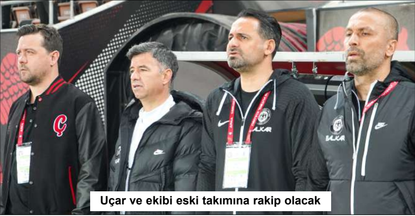
Uçar ve ekibi eski takımına rakip olacak