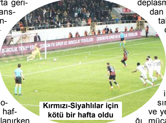
Kırmızı-Siyahlılar için kötü bir hafta oldu

Toplam 24 golün kaydedildiği haftada fileler havalanırken atılan gollerin 12'si ev sahibi