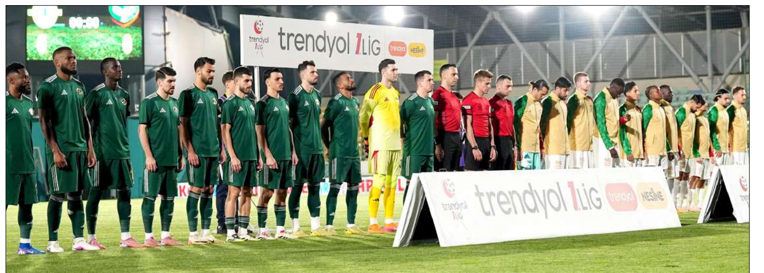
Şampiyonun da, küme düşen takımın da belli olma ihtimali olan haftada Arca Çorum FK için de birçok kritik ihtimal var.