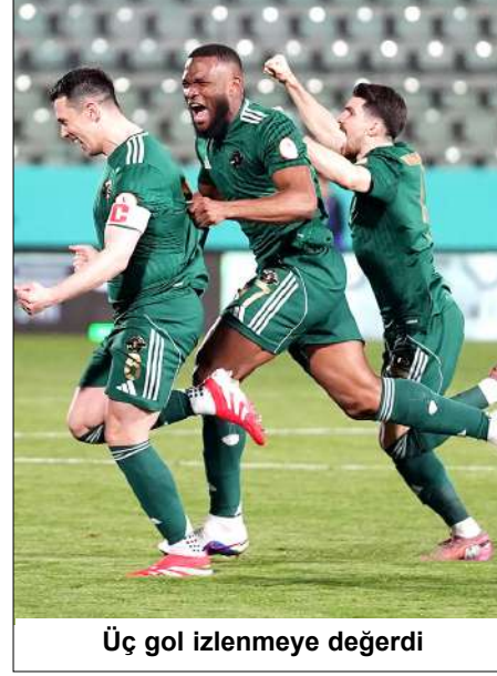
Üç gol izlenmeye değerdi