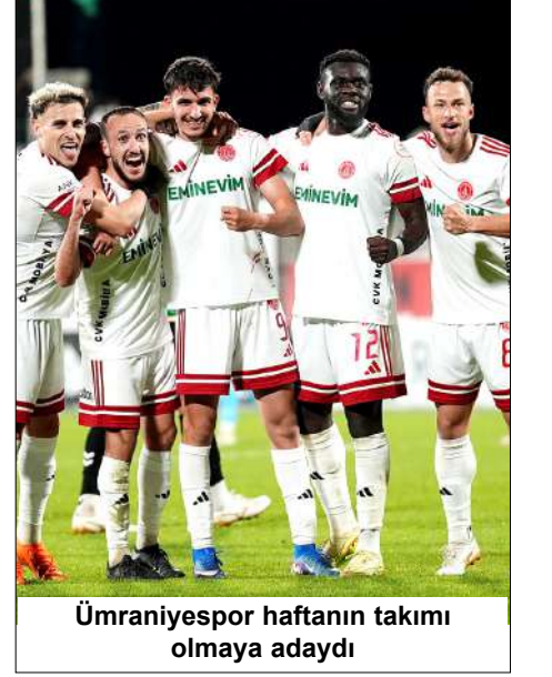
Ümraniyespor haftanın takımı olmaya adaydı