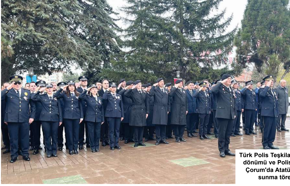
Türk Polis Teşkilatı'nın 181. kuruluş yıl dönümü ve Polis Haftası dolayısıyla Çorum'da Atatürk Anıtı'nda çelenk sunma töreni düzenlendi.