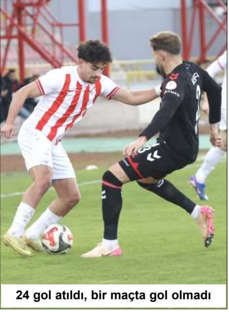
24 gol atıldı, bir maçta gol olmadı