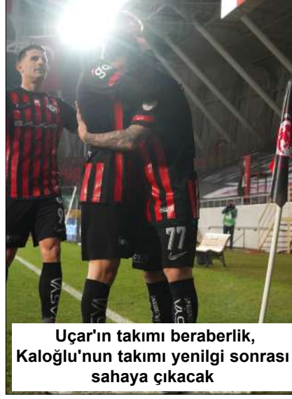
Uçar'ın takımı beraberlik, Kaloğlu'nun takımı yenilgi sonrası sahaya çıkacak