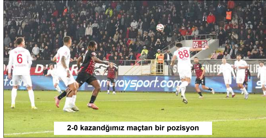
2-0 kazandığımız maçtan bir pozisyon