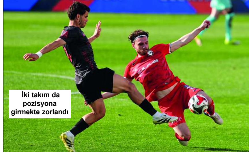
İki takım da pozisyona girmekte zorlandı