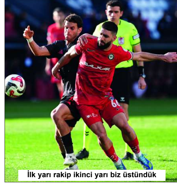
İlk yarı rakip ikinci yarı biz üstündük