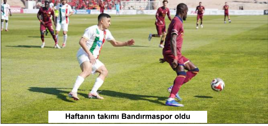
Haftanın takımı Bandırmaspor oldu