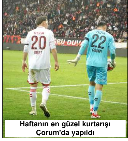
Haftanın en güzel kurtarışı Çorum'da yapıldı