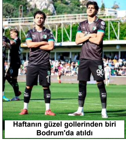
Haftanın güzel gollerinden biri Bodrum'da atıldı