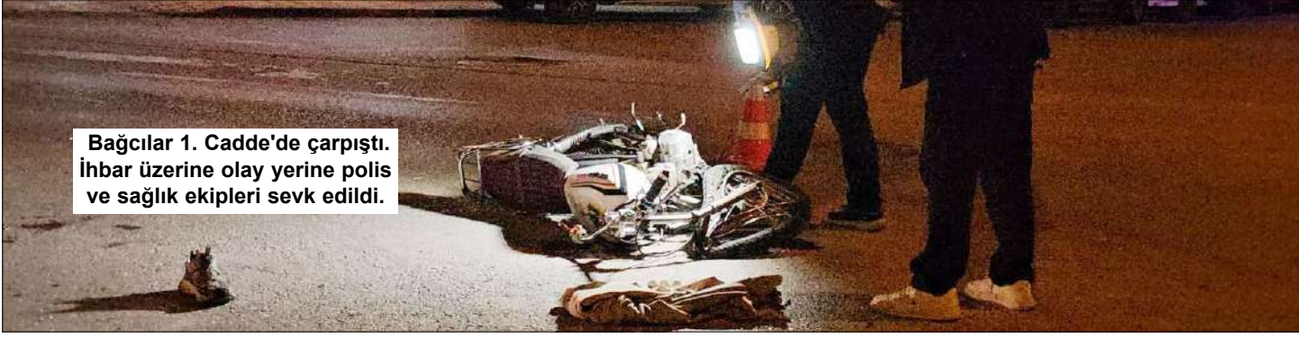
Bağcılar 1. Cadde'de çarpıştı. İhbar üzerine olay yerine polis ve sağlık ekipleri sevk edildi.