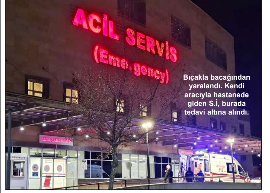
Bıçakla bacağından yaralandı. Kendi aracıyla hastanede giden S.İ. burada tedavi altına alındı.