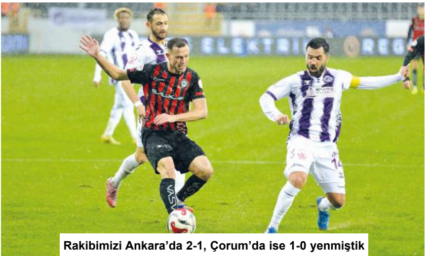
Rakibimizi Ankara'da 2-1, Çorum'da ise 1-0 yenmiştik