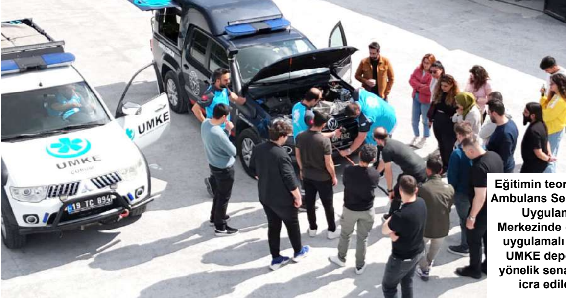
Eğitimin teorik bölümlerinin İl Ambulans Servisi Başhekimliği Uygulama ve Eğitim Merkezinde gerçekleştirildiği uygulamalı kısımlarının ise UMKE deposunda sahaya yönelik senaryolar eşliğinde icra edildiği bildirildi.

tılımcıların yalnızca bilgi düzeylerinin değil aynı zamanda sahadaki refleksleri ile ekip koordinasyon kabiliyetlerinin de geliştirildiği belirtildi. Çorum İl Sağlık Müdürlüğü tarafından yapılan kurumsal değerlendirmede afet ve acil durumlara hazırlıklı güçlü ve koordineli bir sağlık hizmeti yapısının sürdürülebilirliği adına faaliyetlerin süreci aktarılarak "Hem yeni gönüllülerin sisteme kazandırılmasına hem de mevcut personelinin bilgi ve becerilerinin güncel tutulmasına yönelik eğitim programlarımız artarak devam edecektir" denildi. (Haber Merkezi)