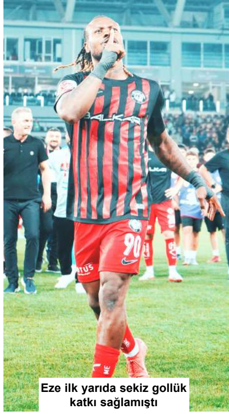
Eze ilk yarıda sekiz gollük katkı sağlamıştı