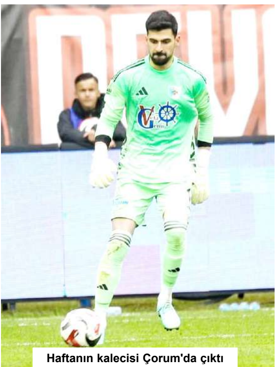
Haftanın kalecisi Çorum'da çıktı