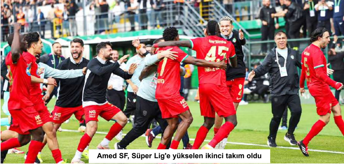
Amed SF, Süper Lig'e yükselen ikinci takım oldu