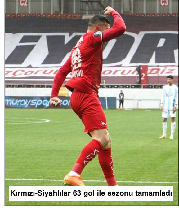
Kırmızı-Siyahlılar 63 gol ile sezonu tamamladı

Arca Çorum FK ise çıktığı 38 maçta rakip fileleri 63 kez sarstı. (Haber Merkezi)