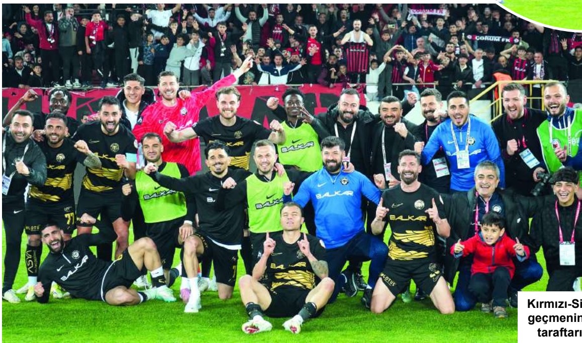
Kırmızı-Siyahlılar turu geçmenin coşkusunu taraftarı ile kutladı