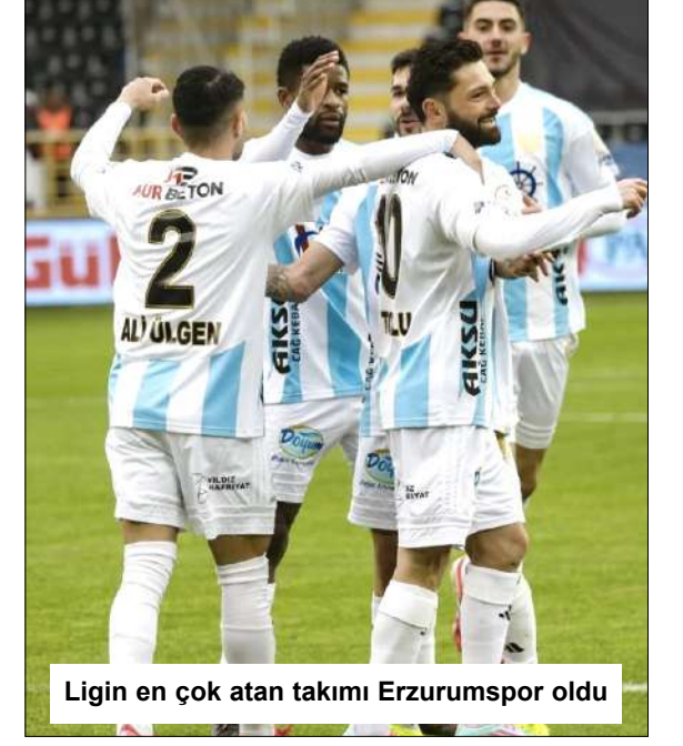
Ligin en çok atan takımı Erzurumspor oldu