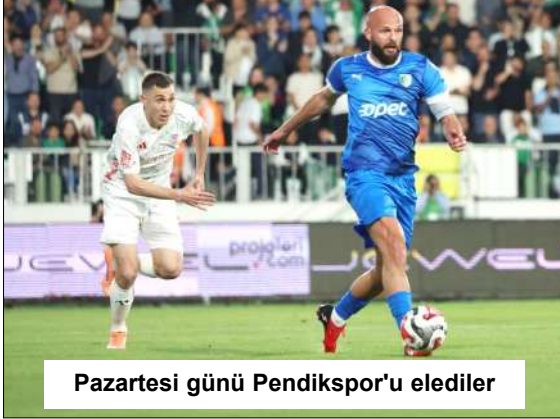
Pazartesi günü Pendikspor'u eleddiler

Arca Çorum FK ile Bodrum FK arasında bu güne kadar oynanan sekiz resmi karşılaşmada tam bir denge hakim görünüyor. Her iki takımın da 2'şer galibiyeti bulunurken, dört müsabaka ise beraberlikle sonuçlandı. Bu sezon ligin ilk yarısında oynanan maçı Bodrum temsilcisi, uzun süre 10 kişi oynayan temsilcimize karşı 4-0 kazanarak, Kırmızı-Siyahlılara bu sezonki en farklı mağlubiyetini yaşatmış, ligin ikinci yarısındaki randevu ise 1-1'lik eşitlikle noktalanmıştı. Bu maçta da Thiam, 84'üncü dakikada penaltı