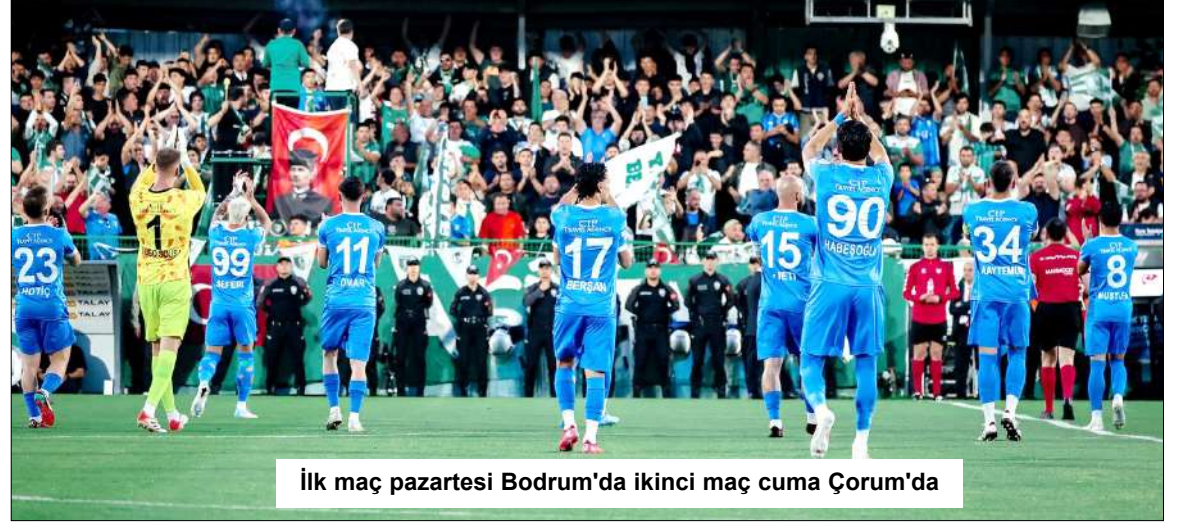
İlk maç pazartesi Bodrum'da ikinci maç cuma Çorum'da