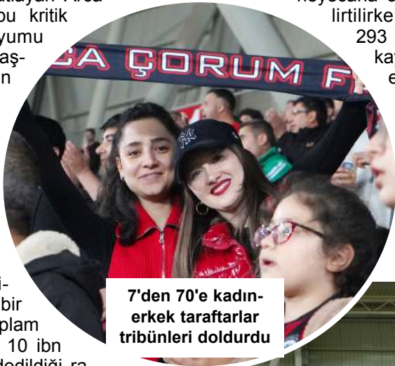
7'den 70'e kadın-erkek taraftarlar tribünleri doldurdu