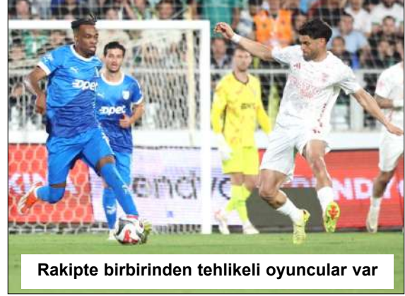
Rakipte birbirinden tehlikeli oyuncular var