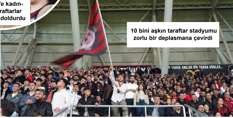
10 bini aşkın taraftar stadyumu zorlu bir deplasmana çevirdi