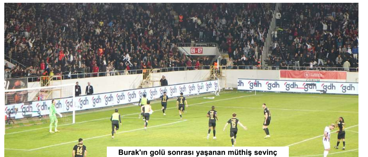
Burak'ın golü sonrası yaşanan müthiş sevinç

faul çalınması gerektiğini savunan Demirlenk "Bu hata değil!" diyerek art niyet vurgusu yaptı. (Abdulkadir Söylemez)