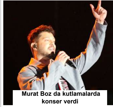
Murat Boz da kutlamalarda konser verdi