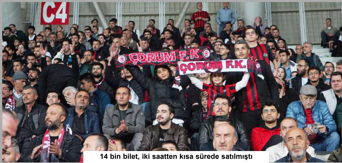
14 bin bilet, iki saatten kısa sürede satılmıştı