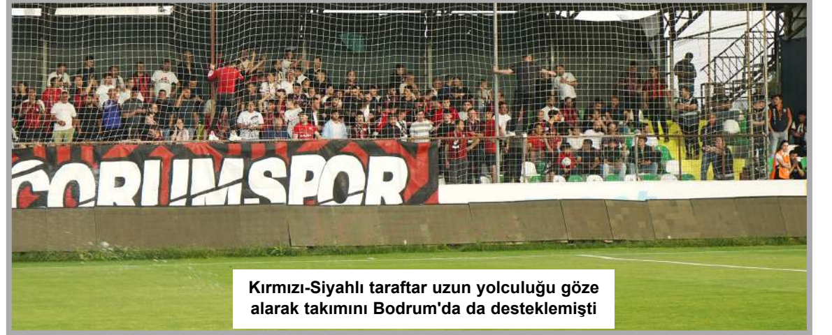
Kırmızı-Siyahlı taraftar uzun yolculuğu göze alarak takımını Bodrum'da da desteklemişti