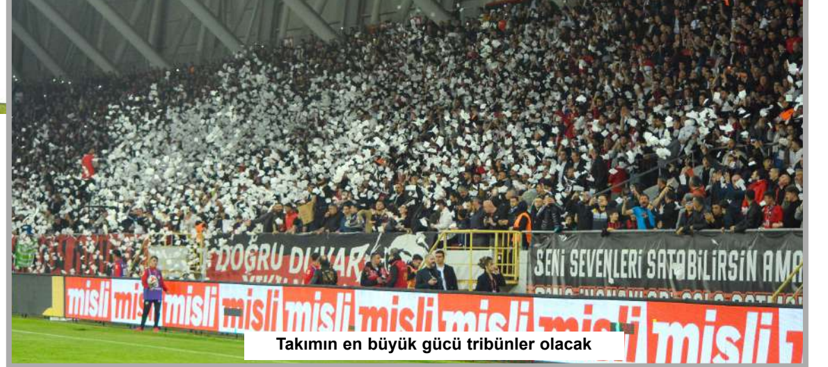
Takımın en büyük gücü tribünler olacak