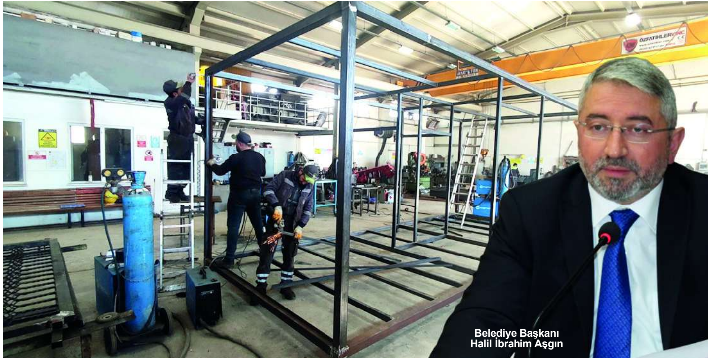
Belediye Başkanı Halil İbrahim Aşgın

Çorum Belediyesi, afet bölgesinin en büyük ihtiyaçlarından birisi olan konteyner için harekete geçti. Makine İkmal, Bakım ve Onarım Müdürlüğünde üretimine başlanan konteynerler deprem bölgesine gönderilecek. İçerisinde banyo, tuvalet, mutfak ve iki odası bulunan 21 metre-karelik konteynerler, depremzedeler için yaşam alanı olacak. Çorum Belediyesi, depremzedeler için 50 adet konteyner ile kampanyayı başlattı. 7'DE