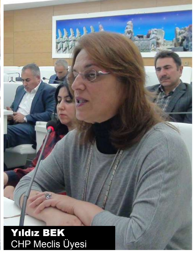
Yıldız BEK CHP Meclis Üyesi