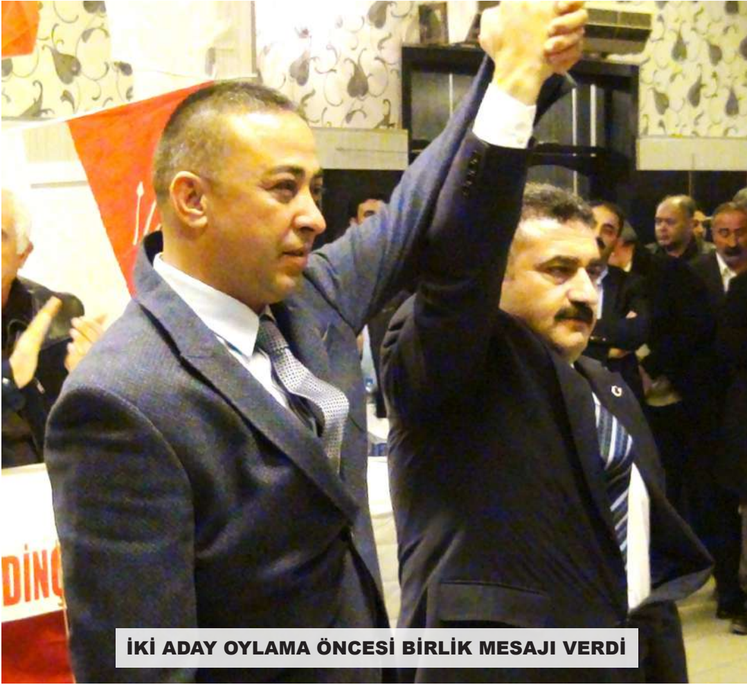
İKİ ADAY OYLAMA ÖNCESİ BİRLİK MESAJI VERDİ

CHP Çorum Merkez İlçe Kongresi hafta sonu yapıldı. Kongrenin yapıldığı salonun önünde bu salonda CHP bir toplantı yapıyor izlenimi veren bir kalabalık ve bir miktarda parti bayrağı vardı. Ancak salonun önünde bu salonda CHP Merkez İlçe Kongresi yapıyor izlenimi veren herhangi bir ibarenin olmaması da ayrıca ifade edilmeli. 6