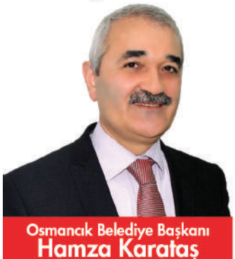
Osmaniye Belediye Başkanı Hamza Karataş

Osmaniye Belediyesi'nin çalışmalarını izlemek için Akıllı Telefonunuza QR Kodunu Okutun