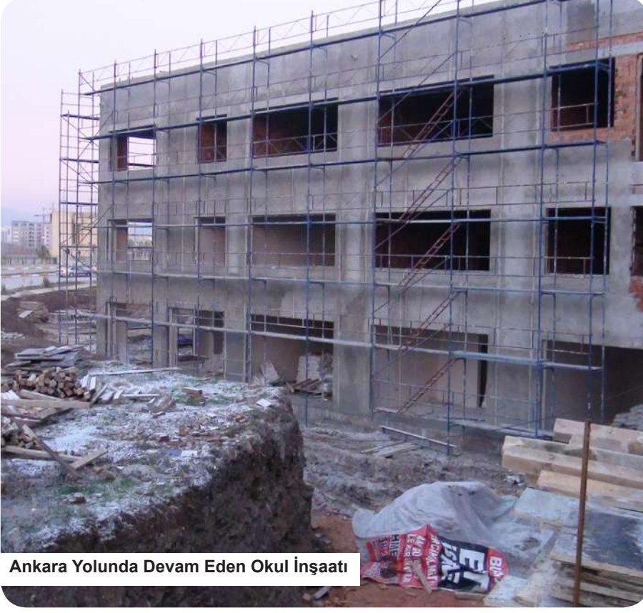
Ankara Yolunda Devam Eden Okul İnşaatı