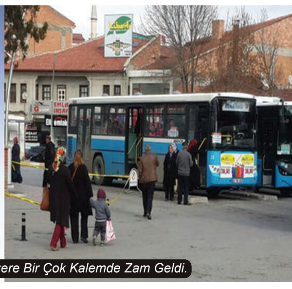
Su ve Ulaşım Başta Olmak Üzere Bir Çok Kalemde Zam Geldi.