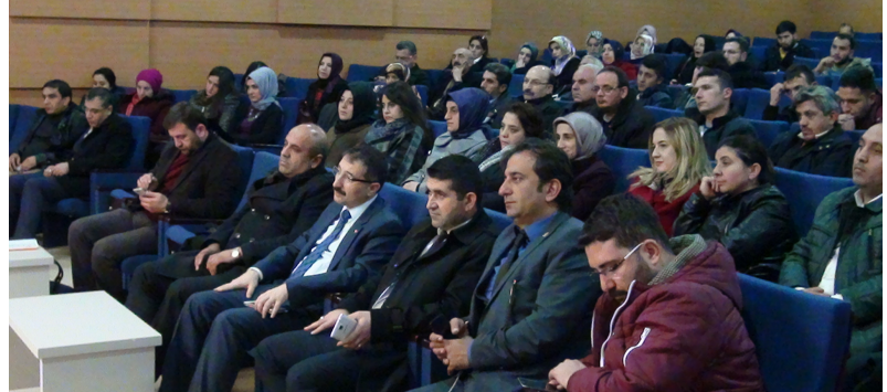
Ak Parti Sosyal İşler, Halkla İlişkiler ve Merkez İlçe yönetiminde görev alan bir grup partili tarafından organize edilen program Turgut Özal İş Merkezi Konferans salonunda gerçekleştirildi.