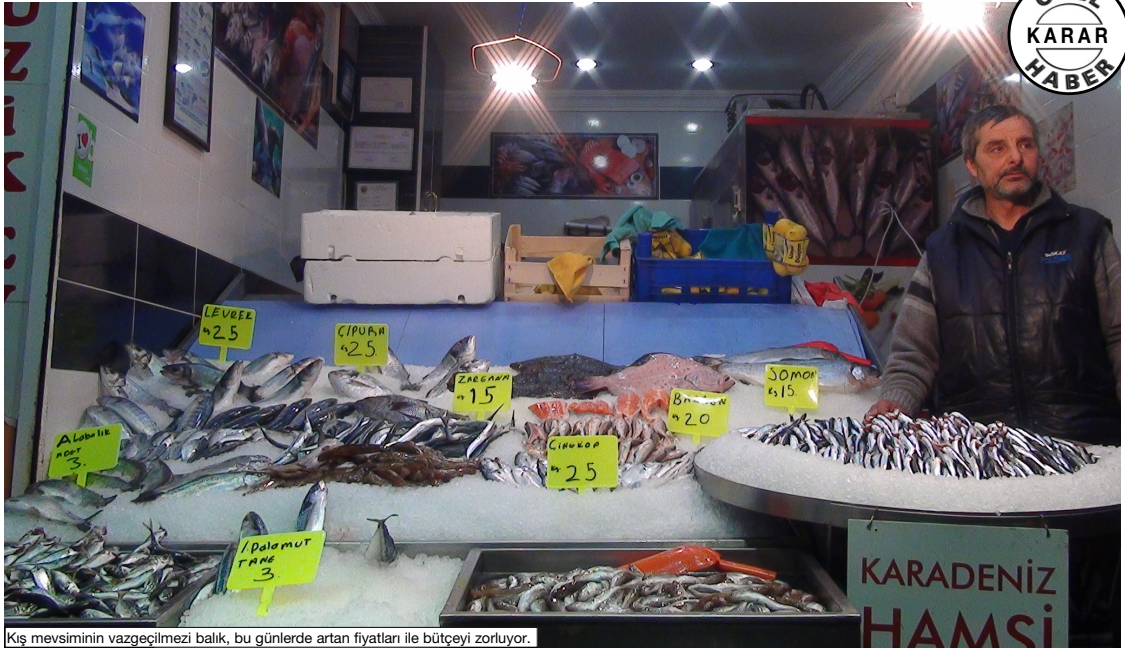
Kış mevsiminin vazgeçilmez balık, bu günlerde artan fiyatları ile bütçeyi zorluyor.

Çorum da balık tezgahlarında bu yıl çeşit azlığı görülürken, düzenli balık tüketen vatandaşlar Çorum balık tezgahlarındaki fiyatların normal olduğunu ifade ediyor. Satıcılar genel olarak satışlardan memnun. HALUK SÖYLEMİZ