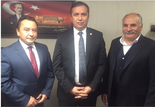
ÇRT ve Karar Gazetesi yöneticilerine ziyaretinizden dolayı teşekkür eden Ceylan yeni dönemde Çorumda tarımın ve sanayinin paralel olarak aynı seviyede geliştirilmesi yönünde çalışmalar yapacağını belirtti

Çorum için öncelikli yatırımların karar yolları gündeki eksiklikleri tamamlamak olduğunu ifade eden Ceylan "Çorum-İskilip karayolu başladı. İskilip-Çankırı bağlantı yolunu yapmamız gerekiyor. İskilip-Tosya yolu, Çorum-Kırkdilim-Osmancık yolu, Alaca yolunda sıcak asfalt çalışmaları ve Mecidiye duble yol çalışmaları da ilk etapta planlamamız arasında" dedi.