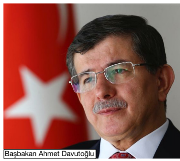
Başbakan Ahmet Davutoğlu