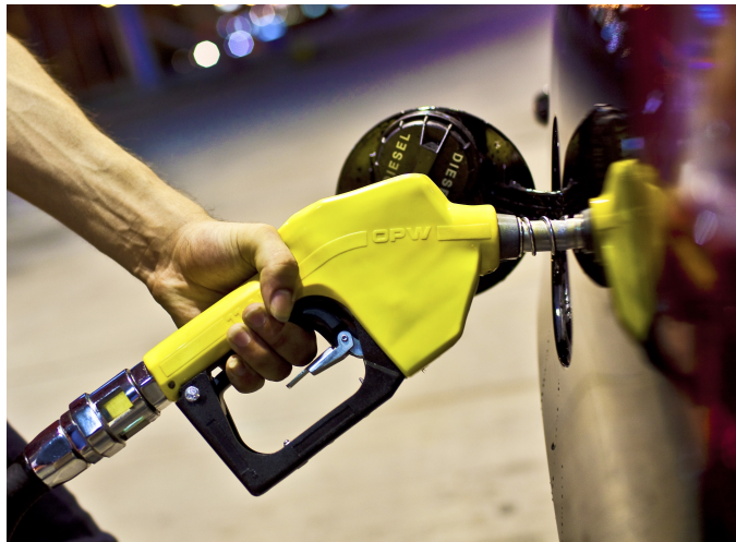
Motorinin litre fiyatına bu gece yarısından geçerli olmak üzere 7 kuruş indirim yapıldı.