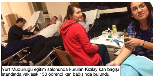
Yurt Müdürlüğü eğitim salonunda kurulan Kızılay kan bağıışı standında yaklaşık 150 öğrenci kan bağıışında bulundu.