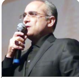
Eski Kültür ve Turizm Bakanı Yalçın Topçu

'TÜRKİYE BAŞKANLIK SİSTEMİNE GEÇİŞİN' Son günlerde yaşanan başkanlık sistemi tartışmalarına da değinen Topçu, "Türkiye başkanlık sistemine geçiş. Türkiye'de sadece siyasi sistem değil, Türkiye'de aslında bütün kanunlar, kurumlar parça parça olmuş, çürümüş bu millete dar geliyor. Onun için bir kısmını resetlemeliyiz ve yeniden formatlamalıyız. Siyasetimizi de resetlemeliyiz. Partiler kanunu da, seçimi de, köhnemiş kurumları da hepsini resetleyip yeniden formatlamalıyız. Neye göre. 10 bin yıllık tarihimiz bin küsur yıllık medeniyet değerlerimize göre. Herseyi buna göre dizayn etmeliyiz" diye