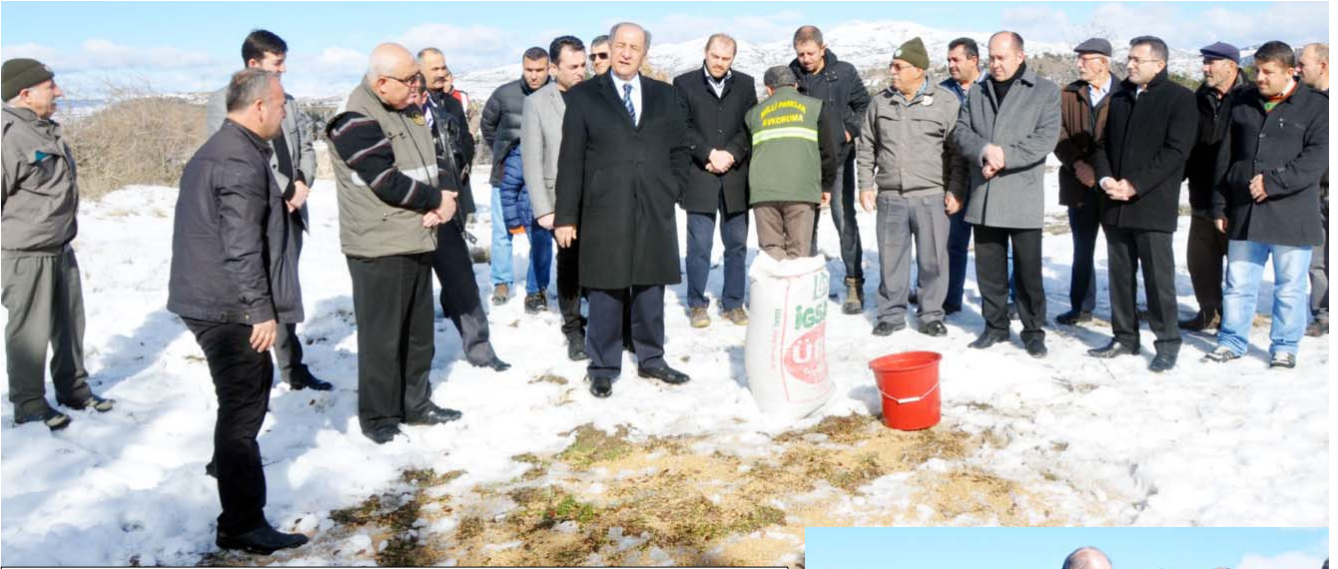
Orman ve Su İşleri Müdürlüğü ile İl Gıda Tarım ve Hayvancılık Müdürlüğü tarafından yaban hayvanları için doğaya 5,5 ton yem bırakıldı.