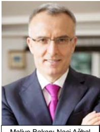
Maliye Bakanı Naci Ağbal

MEMUR ZAMMI Memur zammıyla ilgili de konuşan Naci Ağbal, "2016-2017 yıllarını kapsayan toplu sözleşme görüşmelerinde bu bir derece verilmeye konusunu karara bağladık. 2005 sonrasında ilk defa kamuya giren memurlarımız bulun-