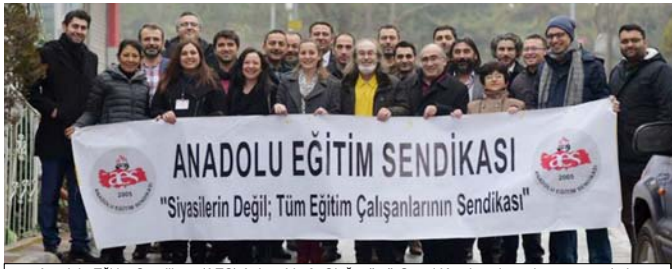
Anadolu Eğitim Sendikası (AES) Ankara'da 3. Olağanüstü Genel Kurulu çalışmalarını tamamladı.

di. Genel Kurul çalışmaları yanı sıra il ve ilçe başkanlarının katılımıyla gerçekleşen Başkanlar Kurulu toplantısında da, 1 Şubat 2015 /1 Şubat 2016 dönemi örgütlenme çalışmaları masaya yatırıldı. Son bir yıl içinde AES'in niteliğinden taviz vermeden, niçel olarak yüzde 30 büyümeyi başardığını altı gizilen Başkanlar Kurulu toplantısında, önümüzdeki dönemde örgütlenme çalışmalarına hız vererek her il ve ilçede, köy okullarına kadar her eğitim kurumunda örgütlenmenin sağlanması için çalışma yürütülmesi kararlaştırıldı.