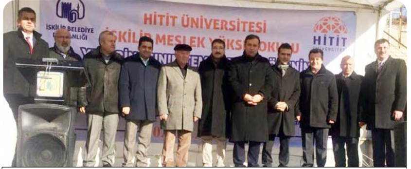
İskilip'e bin öğrenci kapasiteli meslek yüksek okulu binasının yapımına başlandı. İş adamlarının katkılarıyla yapılan meslek yüksek okulunun temeli düzenlenen törenle atıldı.

Temel atma töreninde konuşan Ak Parti Çorum Milletvekili Ahmet Sami Ceylan ise "Bugün hayırlı bir iş için burada bulunuyoruz. Daha önce il başkanlığım zamanında sayın kaymakam İskilip için defalarca bizi ziyaret etti. Bu nedenle sayın kaymakamımızın takipçiliğini, İskilip'e sahip çıkmasını ve bizlerle uyum içinde çalışmasını her zaman takdir ettik. Şu anda bu işin önderliğini üstlenmiş durumda. Bu nedenle İskilip'e yaptığınız değerli hizmetlerden dolayı kaymakamımıza canı gönülden teşekkür ediyoruz" dedi.