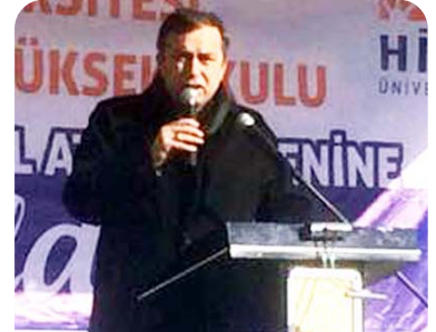
Ak Parti Çorum Milletvekili Ahmet Sami Ceylan

sa ilçe de koşar. Vekil olduğumuz, yemin ettiğimiz dönemde de başkanımızla haftada en az iki kere telefonla İskilip için görüşüyoruz. Bizlerin de görevi sizlere destek olmak. Belediyeye destek olmak. Belediye başkanımıza da teşekkür ediyoruz" dedi. Konuşmaların ardından temel atma töreni gerçekleştirildi. Daha sonra konuklara İskilip dolması ikram edildi.