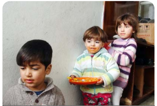
İnsanlık dramının yaşandığı sığınmacı evlerinde, zor hayat şartları en çok çocukları etkiliyor.

İnsanlık dramının yaşandığı sığınmacı evlerinde, zor hayat şartları en çok çocukları etkiliyor. Bazı evlerde yakacak ve soba bulunmadığı için soğuk evlerde kalan çocuklardan birçoğu hastalıklarla mücadele ediyor. Makarna ve ekmeğin yanı sıra doyanan çocuklardan bazılarının ayağında çorap dahi yok. Havalar soğudu, hastalık baş gösterdi