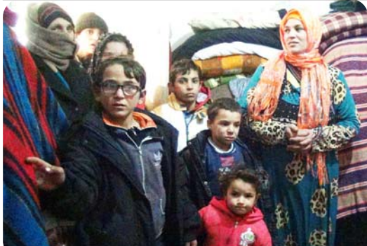
Çocuklarıyla birlikte savaştan kaçıp Türkiye'ye sığınan Türkmenlerden bir bölümü de Çorum'da yaşıyor.