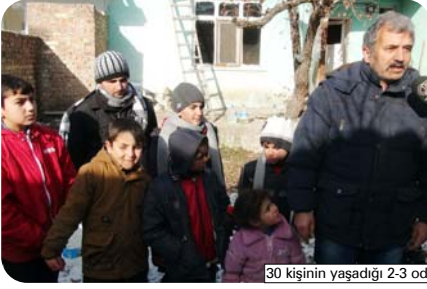
30 kişinin yaşadığı 2-3 odalı evlerde, ağır kış şartlarında yaşayan Türkmenler, yapılan yardımlar sayesinde hayatlarını sürdürüyor.