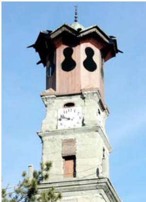
Sungurlu Saat Kulesi

Sungurlu saat kulesindeki saatin parçalarının önceki dönemlerde kaybolduğu belirtiliyor. Önceki dönem belediye yönetiminin kuledeki saatin çanını ve bazı parçalarını korumadığı ve bu nedenle kaybolduğu hatta satıldığı iddia ediliyor. Çanı ve bazı önemli parçaları kaybolan kuledeki saatinin çalışması için çabalar devam ediyor.