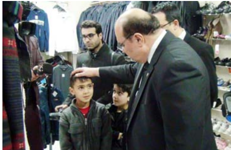
orum'da Sosyal Yardımlařma ve Dayanıřma Vakfı bnyesinde kurulan Sevgi arřısına hayırevevler tarafından gnderilen yeni kıyafetler, ihtiya sahiplerinin beđenmesine sunuluyor.