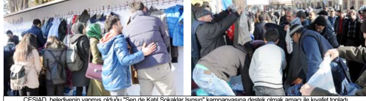
ÇESİAD, belediyenin yapmış olduğu "Sen de Katıl Sokaklar Isınsın" kampanyasına destek olmak amacıyla kıyafet topladı.