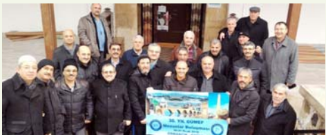
Sosyal medya üzerinden örgütlenen Gazi mezunları kiş sezonun olmasına rağmen Osmancık Kültür Turizm Derneği'nin organizasyonu ile Osmancık'ta anılarının canlılığı iki günü değerlendirdi.