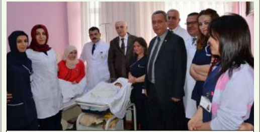
Çorum'da uygulanan ilk tüp bebek yöntemiyle hamile kalan 38 yaşındaki anne sağlıklı bir erkek çocuk dünyaya getirdi.

Kıdem tazminatının işçi ve işveren açısından sorunlar oluşturduğuna işaret eden Elvan, "Her iki kesimin sıkıntılarını ortadan kaldıran orta yolu bulacağız. Kıdem tazminatına ilişkin düzenlemeyi önümüzdeki günlerde TBMM'ye sevk edeceğiz. Bu hafta sonu itibarıyla esneklik ve özel istihdam bürolarıyla ilgili yasa tasarılarını TBMM'ye sunacağız" diye konuştu.