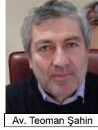
Av. Teoman Şahin

Şimdi dava yeniden bu sefer ileri sürülen gerekçeler ışığında yeniden ele alınacaktır. Çorumlu olarak kişisel beklentim