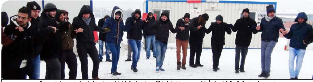
Çorum Ankara yolu üzerinde bulunan bir fabrikada çalışan 62 işçinin işine son verildi. İşçiler, fabrika önünde eylem yaptı.

ABONE ŞARTLARI 6 Aylık : 100 TL Yıllık : 180 TL Yurt İçi Yıllık : 450 TL Yurt İçi 6 Aylık : 235 TL Yurt Dışı Yıllık : 200 EURO Yurt Dışı 6 Aylık : 100 EURO Organize Sanayi Yıllık : 240 TL Organize Sanayi 6 Aylık : 140 TL