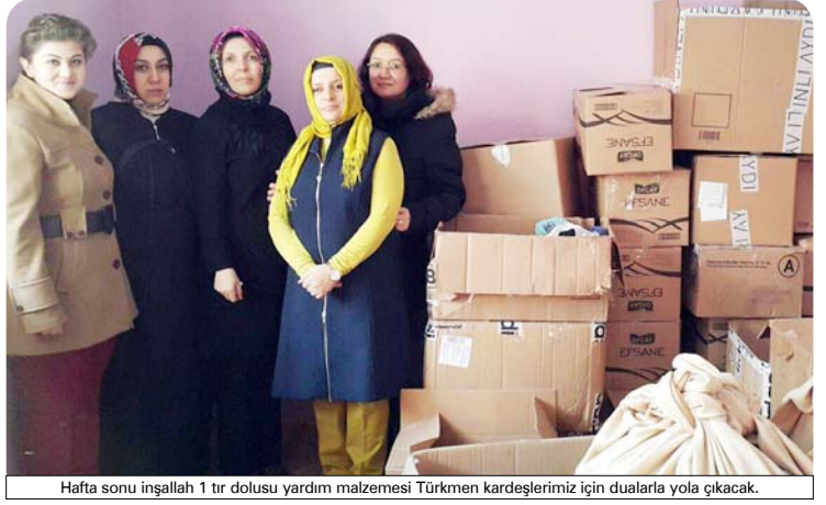
Hafta sonu inşallah 1 tır dolusu yardım malzemesi Türkmen kardeşlerimiz için dualarla yola çıkacak.