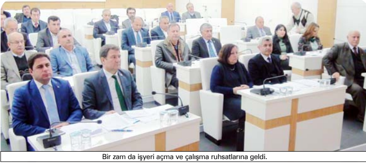
Bir zam da işyeri açma ve çalışma ruhsatlarına geldi.