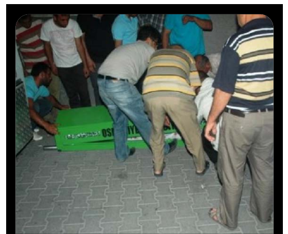
Kapıyı açıp eve giren komşuları yaşlı kadının cesediyle karşılaşınca durumu hemen polise bildirdi.