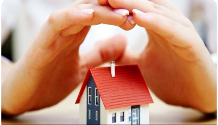
Hükümet, ev sahibi olmak isteyenlere devlet desteği sağlanması için hazırlıkları tamamladı.

nacak ve hak sahibine banka aracılığıyla ödenecek. 2016'da başlayacak sistemde ilk devlet katkısı ödemeleri, 2019 yılında yapılacak. (Haber Merkezi)