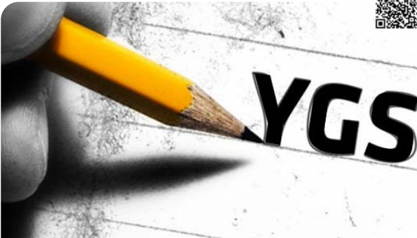
Üniversiteye girişte ilk aşama olan YGS'ye başvuru dönemi bugün başlıyor. Başvurular, 20 Ocak'a kadar devam edecek. LYS başvuruları ise 1-14 Nisan 2016'da alınacak.