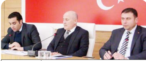
Dün toplanan İl Genel Meclisi Plan Bütçe Komisyonunun raporu doğrultusunda işyeri açma ve ruhsat ücretlerini yeniden belirledi.

ve metrekare ücretlerinin alınması, ruhsat devri, ruhsat kayıp yenilemesi durumlarında gayrisihhi müesseselerin sınıflarına göre ruhsat ücretinin yarısı alınacak. Ayrıca metrekare ücretinin 500 metrekareye kadar belirlenen ücretten, 500 metrekareden fazlası alanlar için ise metrekare ücretinin alınması, kamu kurum ve kuruluşlarında ticari amaç olmayan işlerde, ruhsat ve metrekare ücreti alınmaması kararlaştırıldı. (Haluk SÖYLEMEZ)