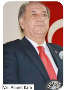
Vali Ahmet Kara

- Hava çok soğuk yarı karlı hava bir tatil daha istiyorum - Vali amca tatil yapmazsan okula giderken hasta oluruz derslersen geri kalınız vali amca - Bu soğukta okula gitmeyeceğiz herhalde? - Havalar soğuk yerler buz, bizi bu havada okula gönderme vali amca - Buz gibi hava tatil olsun 1 gün - Yerler buz nasıl gidelim biz okula - Vurur yüzü ifadesi tatil yapsana be bitanesi - Yarın tahminlere göre -8 olacakmış donanır hastalanız sonra dersten geri kalınız vali amca - Ahmet'tir Onun Adı Kara'dır Soyadı Hadi Be Ahmet Dayı... - Okulumuz hastalıktan geçilmiyor üstüne bir de bu soğuk lütfen anlayışlı olun. - Vali amca okulu tatil yapsana yapsana - Vali dayı; arkadaşında dediği gibi şiddetli yağış bekleniyor giderken 1 saat gelirken 2 saat çile çekiyoruz derslerden geri kalıyoruz şiddetli kar bitene kadar tatil talebini bekliyoruz. Saygılarınımla. - Vali amca okulu yanında tatil et havalar çok soğuk dışarı çıkmıyordur. - Vali bey bu şartlarda bizi okula göndermeyecek kadar şefkatli olduğunu biliyoruz. - Benim evim uzak sabah geç kalırım kar nedeniyle okul soğuk ve buz tutar eldivenli ellerim kalem tutar vali amca versen bi tatil.