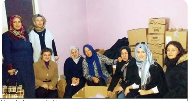
Çorum halkı Bayır Bucak Türkmenleri için yardım kampanyası başlatıldı.