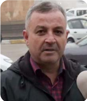
Türkiye'nin devlet başkanlığına ihtiyacı var. Tek iktidar dönemi olmalı. Tayyip Erdoğan'ın başkanlığına destekliyorum. Türkiye için uygun bir proje bundan yıllar önce olması gerekiyordu. Koalisyon ve muhalefet ile yönetimlerde başarı sağlanıyor.