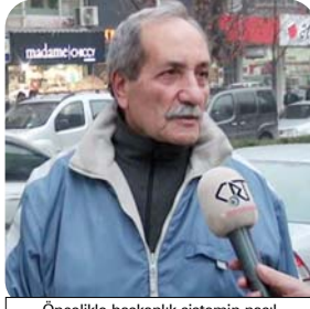
Öncelikle başkanlık sistemin nasıl uygulanacağı konusunun halka iyi anlatılması lazım. Uygun görülürse olabilir.