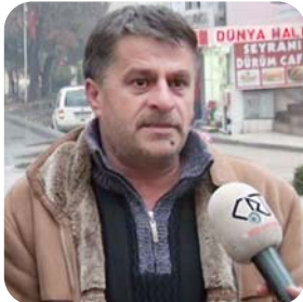
Başkanlık sistemine geçilmemeli. Parlamenter sistem daha güzel. Başkanlık sisteminde tek adamın dediği olur. Başkanlık sistemiyle yönetilen ülkeleri görüyoruz. Onun için ben başkanlık sistemini kabul etmiyorum.

1 Kasım seçimlerinin ardından, siyasi partilerin gündeminde başkanlık sistemi tartışmaları var. Başbakan Ahmet Davutoğlu, "Sistemin ürettiği sorunları göz önünde bulundurarak, Türkiye için en doğru siyasi sistem başkanlık sistemi" derken muhalefet partileri ise başkanlık sistemine karşı açıklamalarda bulunuyor. "Türkiye başkanlık sistemine geçmeli mi" sorusunu Çorum halkına yönelttik. Bu konuda vatandaşlardan farklı yorumlar geldi. Kafaaların karışık olduğu başkanlık sistemi konusunda siyasal tercihler ve konunun anlaşılabilmiş olması cevapları etkileyen faktör olarak karşımıza çıkıyor. İşte Çorum'un farklı tercihleri: (Haluk SÖYLEMEZ)