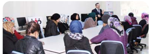
Çorum Aile ve Sosyal Politikalar İl Müdürlüğü toplumun temelini oluşturan ailenin eğitimi konusunda önemli çalışmalar gerçekleştirdi.

Kuyumcular Çarşısı Ahlatıcı Kuyumculuk Yanı