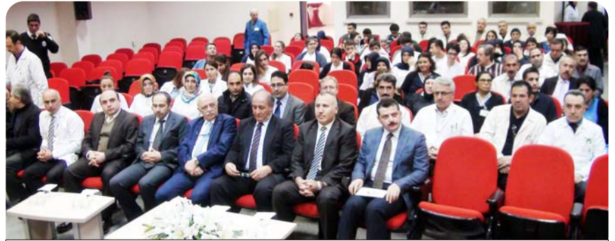
Hitt Üniversitesi Eğitim ve Araştırma Hastanesi tarafından, Sarıkamış Şehitleri için anma programı düzenlendi.