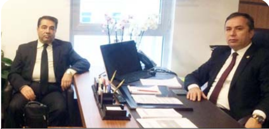
CHP Çorum Milletvekili Av. Feridun Ayyazoğlu, Ak Parti Çorum Milletvekili, Ahmet Sami Ceylan'ı makamında ziyaret etti.

misyon üyesi seçilmesinden dolayı tebrik ederek, görevinde başarılar diledi. Ziyaretten duyduğu memnuniyeti dile getiren Ceylan, konuklarına teşekkür etti. (Haber Merkezi)