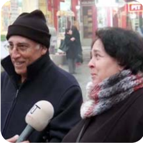
Bence geçmesin. Çok fikrim yok ama alışa gelmiş gibi devam edelim.