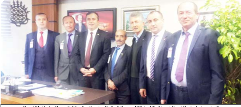
Bayat Muhtarlar Derneği Yönetim Kurulu, Ak Parti Çorum Milletvekili, Ahmet Sami Ceylan'ı ziyaret etti.