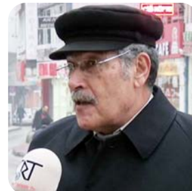
Başkanlık sistemi Türkiye için iyisye geçilmeli, iyi değilse geçilmemeli. Benim kişisel kanaatim geçmesinden yana. Çünkü meclis tıkanıyor. Tıkanmamalı. Yalnız diktatörlük olamamalı. Gerçek demokrasilerdeki başkanlık sistemi olmalı.

1 Kasım seçimlerinin ardından, siyasi partilerin gündeminde başkanlık sistemi tartışmaları var. Başbakan Ahmet Davutoğlu, "Sistemin ürettiği sorunları göz önünde bulundurarak, Türkiye için en doğru siyasi sistem başkanlık sistemi" derken muhalefet partileri ise başkanlık sistemine karşı açıklamalarda bulunuyor. "Türkiye başkanlık sistemine geçmeli mi" sorusunu Çorum halkına yönelttik. Bu konuda vatandaşlardan farklı yorumlar geldi. Kafaaların karışık olduğu başkanlık sistemi konusunda siyasal tercihler ve konunun anlaşılabilmiş olması cevapları etkileyen faktör olarak karşımıza çıkıyor. İşte Çorum'un farklı tercihleri: (Haluk SÖYLEMEZ)