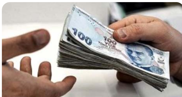
Esnaf ve sanatkarların geçen yıl için belirlenen kayıt ücreti ve yıllık aidat tarifesini, 31 Aralık 2016'ya kadar uygulanmaya devam edecek.

asgari ücretin yüzde 10'u oranında kayıt ücreti ve yıllık aidat uygulanan il, ilçe ve meslek gruplarında bu yıl için belirlenen asgari ücretin brüt tutarının yüzde 10'u oranında kayıt ücreti ve yıllık aidat tahsil edilecek. Yönetmelik, 1 Ocak'tan geçerli olmak üzere yürürlüğe girdi.