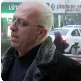
Başkanlık sisteminden öte bundan sonraki dönemlerin tamamında türkiyede başkanlık olduğu zaman bizim ekonomik siyasal her anlamda dünyadaki ve bölgedeki gücümüz adına, insanların ve halkın mutlu olması adına hangisi uygunsuz çok objektif değerlendirmelerde sonra karar verilmeli. Çünkü bazen ön yargıyla hayır veya ön kabul ile evet demek yerine daha objektif olmalı diye düşünüyorum. Yani siyasi ön yargılardan arınarak bakmak lazım. Tamamen dünya ölçeğindeki demokrasiye göre oturduğu zaman sistem rejimi yoksa parlamenter sistem de uygulanırsa, başkanlık sistemi de uygulanırsa mutlu etmez. Onemi olan insanların mutluluğu.