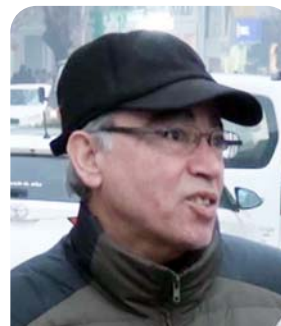
Başkanlık sisteminin alt yapısında neler var. Bunların ortaya çıkması lazım. Bu konuda çok fazla bilgim olmadığı için yorum yapamayacağım.