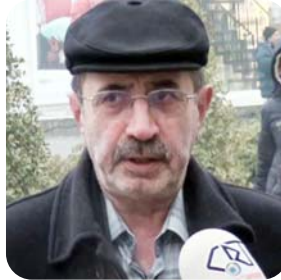
Başkanlık sistemine geçilmemeli. Başkanlık sistemi diktatörlüğü getirir.

Başkanlık sistemi konuşulurken, Çorum'da vatandaşın kafası karışık. Yarın referandum olsa ne olduğu bilinmeden oy verilecek. Siyasetin doruklarında Başkanlık sistemi konuşulurken, yerelde konu anlaşılabilmiş değil