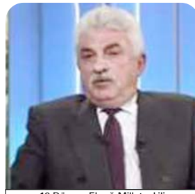
19.Dönem Elazığ Milletvekili Tuncay Şekericioğlu