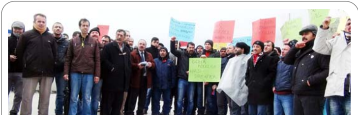
Hazırladıkları pankart ve dövizlerle fabrika önünde tekrar işe dönme umuduyla bekleyen işçilere bazı sendika ve siyasi partilerden de destek geliyor.

poşet içinde sakladıkları altınları ve paralarını buldu. Gözaltına alınan ve emniyetteki işlemlerinin ardından Çorum Eğitim ve Araştırma Hastanesi'ne götürülen Çetin K. ve Hamza S, sağlık kontrolünden geçirildi. Ardından, minibüslü Samsun'dan Çorum'a gelen sivil ekipler iki kişiyi teslim aldı. Şüphelilerin Samsun'da, "terör örgütü tarafından hesaplarının ele geçirildiğini" söyledikleri bir kişiden yaklaşık 100 bin lira değerinde altın, bin avro ile 1500 dolar aldıkları belirtildi. (Haber Merkezi)