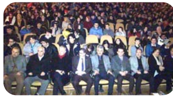
'Amacımız gençlerin örnek kişileri model alması'