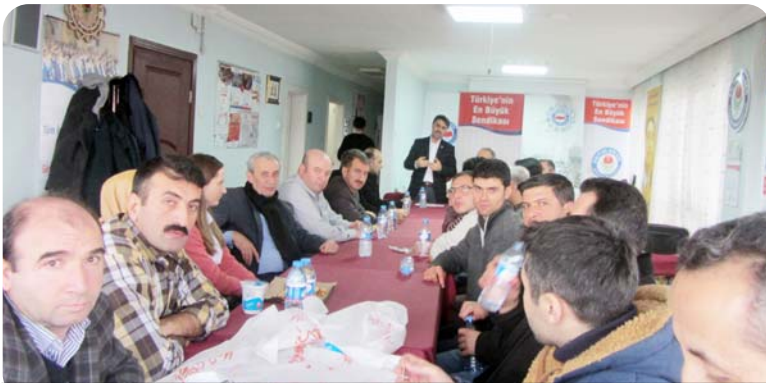
Eğitim Bir Sen Milli Eğitim Bakanlığınca 6 Aralık 2015 tarihinde yapılan Görevde yükselme ve unvan değişikliği sınav sonuçlarını değerlendirdi.

dımcılığı, Şube Müdürlüğü ve Yüksek Öğretim Kurumları Görevde Yükselme sınavlarına hazırlık kitapları bastırarak, modüller hazırlayarak, deneme sınavları yaparak, uzaktan eğitim merkezleri kurarak kariyer yolculuklarında üyelerimizin hep yanında yer aldık ve almaya devam edeceğiz. Sınav sonucu ortaya çıkan tablo sonucu hizmet çitimiz daha da yükselttik. 2016 Mart ayında yapılacak Müdür yardımcılığı ve Müdür Başyardımcılığı sınavı için de hazırlıklarımız devam ediyor. Kitap-