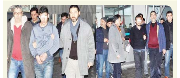
Samsun'da dolandırıcılık yapan "Sahte Polisler" Çorum'da yakalandı.