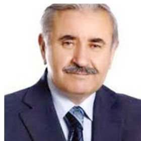
19.Dönem Kayseri Milletvekili Seyfi Şahin