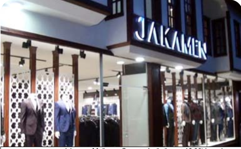
Jakamen Mağazası Cumrtesi günü saat 12.00'de açılışı yapılacak olan 2 katlı mağaza Eğirdere çarşısında hizmet verecek.