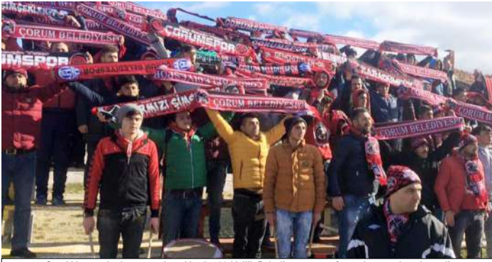
Sandıklispör deplasmanında yaklaşık 100 kişilik Belediyespör taraftarı takımına destek verdi.

8.DAKİKA: Sandıklispörün kazandığı faul atışında soldan İsmail ceza sahasına orta yaptı, kale alanı içerisinde