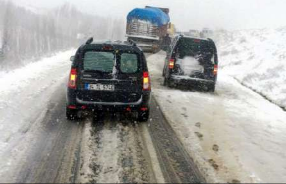
Çorum'da kar yağışı etkisini artırdı. Yoğun kar ulaşımı olumsuz etkiledi.

Çorum'da kar yağışı etkisini artırdı. Yoğun kar ulaşımı olumsuz etkiledi. Kar yağışının şiddetli olduğu Çorum-Osmancık Karayolu Sarmaşa mevki ve Kırkdilim arasında yol trafiğe kapandı. Kar nedeniyle kayan araçların yolu kapaması sonucunda bölgede uzun araç kuyrukları oluştu. Ekiplerin bölgede iki saat süren çalışmalarının ardından yol trafiğe yeniden açıldı.