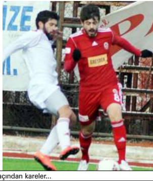
Çorum Belediyespör' un deplasmanda karşılaştığı Sandıklispör maçından kareler...