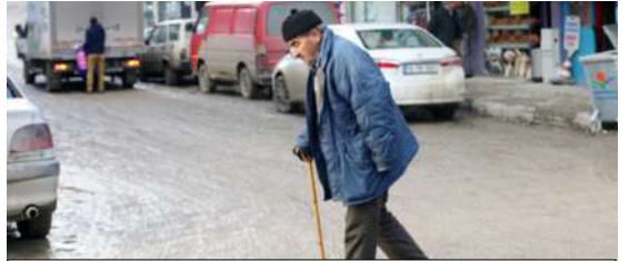
Çorum'un İskilip ilçesinde 3 yıl önce başlatılan ve bir türlü tamamlanamayan alt yapı çalışmaları nedeniyle sokak ve caddeler çamur deryasına döndü.

İskilip halkından sabır isteyen yetkililer ise alt yapı çalışmalarının sonuna yaklaştığını ve yakın zamanda yolların asfaltlanacağını öne sürdü.