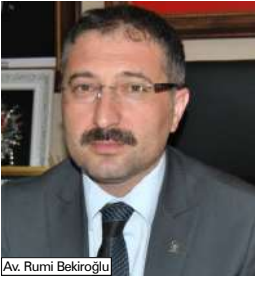
Av. Rumi Bekiroğlu