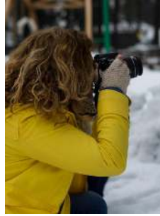
ÇOFSAD yönetimi ile irtibata geçmeleri gerekiyor. Çorum Fotoğraf Sanatı