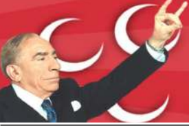
Sinan Ogan, yarın Çorum'da

Milliyetçi Hareket Partisi (MHP) Çorum teşkilatları Alparslan Türkeş için 4 Nisan Pazartesi günü Mevlid okutacak. MHP Çorum teşkilatları adına konuya ilişkin yapılan açıklamada şu ifadeler kullanıldı. "Türk Milliyetçiliğinin bilge lideri "Başbuğ" Alparslan Türkeş, 4 Nisan 1997 cuma günü Ankara da yaşamını yitirmişti. 80 yaşında hayatını kaybeden Alparslan Türkeş, Cumhuriyet tarihinin büyük siyasi liderlerinden. Zorkluklarla dolu yaşamını milletine adanmış Alparslan Türkeş'in ölümü ülkemizde ve Türk Dünyasında büyük üzüntü yaratmıştı. Vefatından yıllar geçmesine rağmen Alparslan Türkeş, Türk Milliyetçilerinin gönlünde hala "başbuğ" diye anılıyor ve yetiştirdiği kadrolar, bina ettiği kurumlar merhum liderlerini rahmetle ve hürmetle anmaya ve onun çizdiği ülkülerin yolunda yürümeye devam ediyorlar. Vefatının seneyi devriyesinde, her yıl olduğu gibi ülkemizde ve Türk Dünyasında anma programları düzenlenecek. Pazartesi günü Beştepe'deki anıt mezarıda düzenlenecek programa her sene olduğu gibi Milliyetçi-Ülkücü teşkilatlar, vatandaşlarımız ve Türk Dünyasından misafirler katılacak. Çorum'da ise Merhum Başbuğ Alparslan Türkeş'in vefatının 19. yılı münasebetiyle 4 Nisan 2016 Pazartesi günü İkinci Namaz Öncesi Ulu Camii'nde okutulacak Mevlidi Şerife tüm hemşehrilerimiz davetlidir."