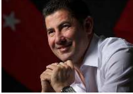
Sinan Ogan, yarın Çorum'da

Milliyetçi Hareket Partisi Genel Merkezi'nin tasarrufları ile pek çok ilde MHP teşkilatları olağanüstü kurultay talepleri olması nedeni ile görevlerinden alındı. Bu görevden almaları karşı, genel başkan adayları olarak yola çıkan Meral Akşener, Sinan Ogan ve Koray Aydın bu teşkilatlara destek ziyaretlerine devam ediyor. 24. Dönem İçişleri Bakanlığı Sinan Ogan kapalı Çorum İl Teşkilatına destek ziyareti kapsamında yarın Çorum'da olacak. Saat 14.00'de Sungurlu Belediyesi ziyareti ile başlayacak olan program saat 17.30'da Anıta Otel'de gerçekleştirilecek salon toplantısı ile sona erecek.