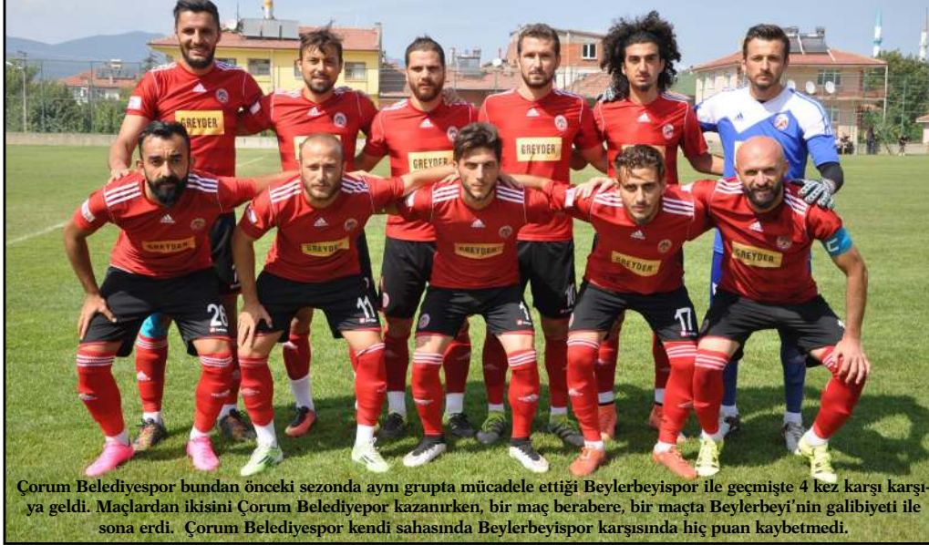
Çorum Belediyespor bundan önceki sezonda aynı grupta mücadele ettiği Beylerbeyispor ile geçmişte 4 kez karşı karşıya geldi. Maçlardan ikisini Çorum Belediyespor kazanırken, bir maç berabere, bir maçta Beylerbeyi'nin galibiyeti ile sona erdi. Çorum Belediyespor kendi sahasında Beylerbeyispor karşısında hiç puan kaybetmedi.

3. ligde özlem sona eriyor. 2016-2017 futbol sezonunda 3. lig. 1. Grupta mücadele edecek olan Çorum Belediyespor ilk sınavını kendi sahasında verecek. Beylerbeyispor'u konuk edecek olan Kırmızı Sıyahlılar, sezona iyi bir başlangıç yapmayı hedefliyor. Çorum Belediyespor yeni transferlerin de yer aldığı yeni kadrosuyla ilk kez taraftarının karşısına çıkacak. Dr.Turhan Kılıçcıoğlu Stadında oynanacak olan karşılaşma saat 16.00'da başlayacak. Ligin ilk müsabakasını Doğu Yılmaz yönetecek. Yılmaz'ın yardımcıları ise Ünal Doğru ve Ömer Lütfü Aydın yapacak.