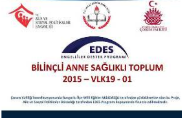
Çorum İlçe Milli Eğitim Müdürlüğü'nde Sungurlu İlçe Milli Eğitim Müdürlüğü tarafından yürütülen proje ile ilgili toplantı. Aile ve Sosyal Politikalar Bakanlığı tarafından EDES Programı kapsamında finanse edilmektedir.

lar, sigara alkol ve madde kullanımı, okul kazaları ve trafik kazaları gibi faktörlerden dolayı sonradan oluşan engelliliğin önlenmesi amacıyla Sungurlu halkında farkındalığı arttırmaya yönelik çalışmalar yapmak. Projenin Beklenen Sonuçları; İlçemizde engelli doğum ve sonradan engelli olma konusunda bilinçlendirmeye artırp farkındalık oluşturmak amaçlanmaktadır."