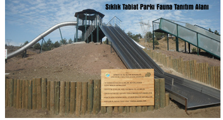
Sıklık Tabiat Parkı Fauna Tanıtım Alanı