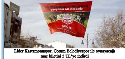
Lider Kastamonuspor, Çorum Belediyespor ile oynayacağı maç biletini 5 TL'ye indirdi