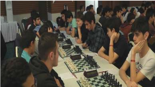
Gençlik ve Spor Bakanlığı Okul Sporları Şube Müdürlüğü tarafından düzenlenen Okul Sporları Satranç Türkiye Birinciliği, Çorum'da başladı.

Çorum önemli bir organizasyona daha ev sahipliği yapıyor. Okul Sporları Satranç Türkiye Birinciliği başladı. Şampiyonaya 68 ilden 550 sporcu katılıyor