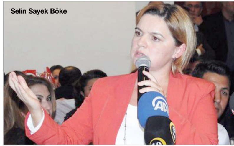
Selin Sayek Böke

Cumhuriyet Halk Partisi (CHP) Genel Başkan Yardımcısı ve Parti Sözcüsü Selin Sayek Böke, Çorum'da partisinin düzenlediği Cumhuriyet Balosu ve Çorum Valiliğinin düzenlediği resepsiyona katıldı. CHP Genel Başkan Yardımcısı Selin Sayik Böke, Çorum'da ilk olarak Valilik tarafından düzenlenen 29 Ekim Cumhuriyet Bayramı Resepsiyonu'na katıldı. Resepsiyon çıkışında açıklamalarda bulunan Böke, "Türkiye'nin gerginleştirilmeyen bir siyasete, kutuplaşılmayan bir siyasete ihtiyacı var. Silahlanarak ve bireysel infazlarla bir yarın inşa edilemez. Türkiye'de çok acilen olağanüstü halin bitirilip artık olağan günlerin inşa edilmesi gerekiyor. Dileriz ki bunu çok hızlı yapmayı akıl edecek bir iktidar olsun" dedi. 4'DE