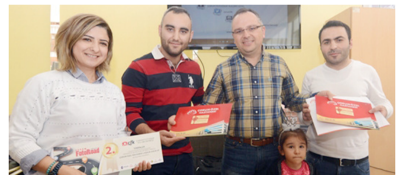
FOTO ROAD'DA ÖDÜLLER SAHİPLERİNİ BULDU

Çorum Fotoğraf Kulübü Derneği (ÇFK) tarafından düzenlenen Foto Road yarışmasında ödülleri sahiplerini buldu. 9 Ekim 2016 Pazar günü Mehmetçik Parkı'ndan başlayan ve büyük eğlenceye sahne olan yarışma 22 takımlı katılım ile gerçekleşmişti. Yarışmada çekilen fotoğrafların değerlendirilmeleri yapılarak dereceye girenler de belirlendi. Yunus Emre Parkı'nda ÇFK tarafından verilen kahvaltılı ile birlikte dereceye girenlere ödülleri verildi. 7'DE