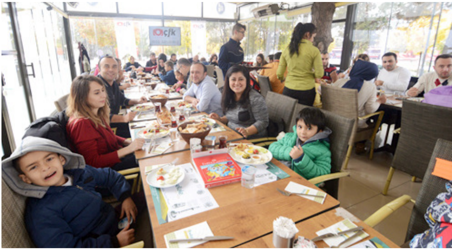
FOTO ROAD'DA ÖDÜLLER SAHİPLERİNİ BULDU