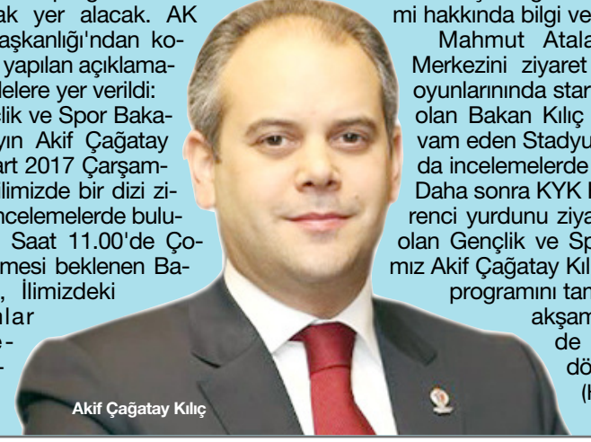
Akif Çağatay Kılıç

Mahmut Atalay Gençlik Merkezini ziyaret edip KYK oyunlarında startını verecek olan Bakan Kılıç yapımı devam eden Stadyum inşaatında incelemelerde bulunacak. Daha sonra KYK Hitit Kız öğrenci yurdunu ziyaret edecek olan Gençlik ve Spor Bakanımız Akif Çağatay Kılıç ilimizdeki programını tamamlayarak akşam saatlerinde Ankara'ya dönecek" (Haber Merkezi)