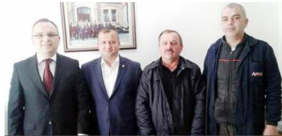
Oto Tamirciler Esnaf Odası, Çorum Özel Hastanesi ve Özel Elitpark Hastanesi ile önceki yıllarda imzaladığı indirim sözleşmesini yeniledi.