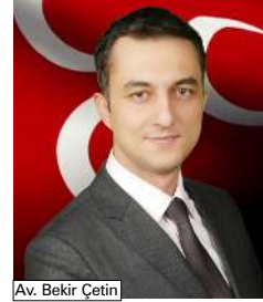
Av. Bekir Çetin

Hak Teala, Bayrağımızı ılelebet vatanımızın semalarında dalgalansın. Üç hilalimizi ömrü uzun olsun. Nice yıllarda Milliyetçi Hareketimizin ve Türk milletinin yolu bahtı açık olsun" dedi.