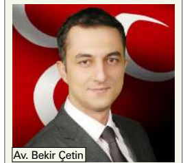
Av. Bekir Çetin