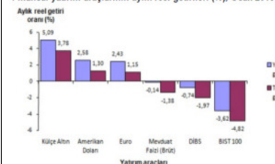
Finansal yatırım araçlarının aylık reel getirileri (%), Ocak 2016

Altı aylık değerlendirilmeye göre Amerikan Doları; Yİ-ÜFE ile indirgenildiğinde yüzde 10,18, TÜFE ile indirgenildiğinde ise yüzde 5,40 oranında yatırımcısına en yüksek kazancı sağladı. Aynı dönemde BİST 100 Endeksi, Yİ-ÜFE ile indirgenildiğinde yüzde 12,97, TÜFE ile indirgenildiğinde ise yüzde 16,74 oranında yatırımcısına en çok kaybettiren yatırım aracı oldu. Yıllık değerlendirilmede en yüksek reel getiri Amerikan Doları'nda gerçekleşti. Finansal yatırım araçları yıllık olarak değerlendirildiğinde Amerikan Doları; Yİ-ÜFE ile indirgenildiğinde yüzde 21,77, TÜFE ile indirgenildiğinde ise yüzde 17,72 oranında yatırımcısına en fazla reel getiri sağladı. Diğer taraftan, BİST 100 Endeksi Yİ-ÜFE ile indirgenildiğinde yüzde 24,13, TÜFE ile indirgenildiğinde ise yüzde 26,65 oranında yatırımcısına en çok kaybettiren yatırım aracı oldu.