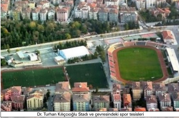
Dr. Turhan Kılıçoğlu Stadi ve çevresindeki spor tesisleri