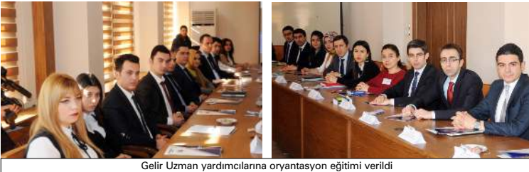
Gelir Uzman yardımcılarının oryantasyon eğitimi verildi

nağının yetiştirilmesi büyük önem taşımaktadır. Ülkelerin gelişiminin arkasında yatan en önemli şey yetişmiş insan kaynağıdır. Dünyadaki ilk on ekonomiyi arasına girmeyi hedefliyoruz. Bunun için mevcut insan kaynağını çok iyi yetiştirmeliyiz. Teorik bilginin yanı sıra pratik bilgi de verilmelidir. Temel ve hazırlayıcı eğitimler gelir uzman yardımcılarımız açısından çok önemlidir. Üç yıl sonra gelir uzmanı olacaklar. Kalemli ellerine almadan önce ön bilgiye sahip olmaları gerekir" diye konuştu. (Ebru ÇALIK)