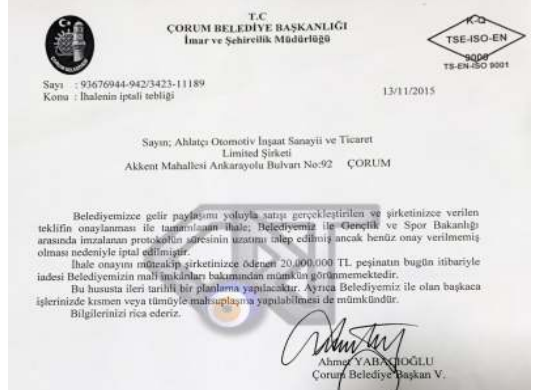
Çorum Belediyesi'nin 13 Kasım 2015 tarihinde Ahlatçı şirketine gönderdiği iptal yazısı

İhalenin iptal edildiğini ve iptal gerekçesinin ise henüz kamuoyuna açıklama gereği duymayan Çorum Belediyesi'nin 13 Kasım 2015 tarihinde Ahlatçı şirketine gönderdiği iptal yazısı ortaya çıktı. İhalenin iptal edildiğine dair Ahlatçı'ya gönderilen tebliğ yazısında iptal gerekçesi olarak, Belediye ile Gençlik ve Spor Bakanlığına arasında imzalanan protokol süresinin uzatılmaması gösterildi. Yazıda, Ahlatçı tarafından ihale için belediyeye ödenen 20 Milyon