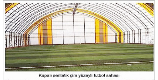
Kapalı sentetik çim yüzeyli futbol sahası

YAPILMASI PLANLANAN SEMT SAHALARI; Günhan Mahallesi mesire alanına 1 adet