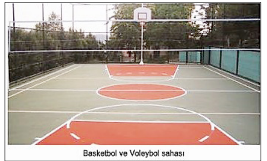
Basketbol ve Voleybol sahası