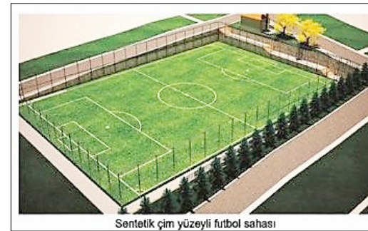
Sentetik çim yüzeyli futbol sahası