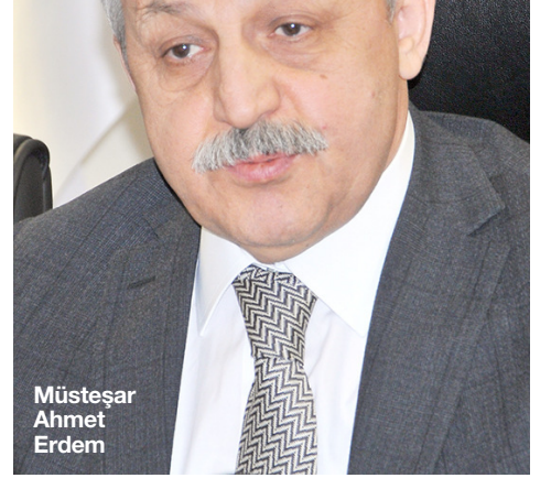
Müsteşar Ahmet Erdem

Sosyal güvenlik alanında Çorum'un geneline bakacak olursak, Çorum'da 527 bin nüfusunun %99,5'i sosyal güvenlik kapsamında. 8 bin 316 işyerinde 112 bin sigortalımız bulunuyor. 53 bin 898 SSK'lı, 24 bin 602 BAG-KUR'lumuz bulunuyor. 13 bin 711 memurumuz var. Çorum'da 6 bin 129 işyerimiz 3 milyon 375 bin lira beş puanlık teşvik indiriminden yararlanmış. 5 bin 431 işyerimiz 3 milyon 38 bin lira 51 ilde uygulanan ilave altı puanlık indirimden