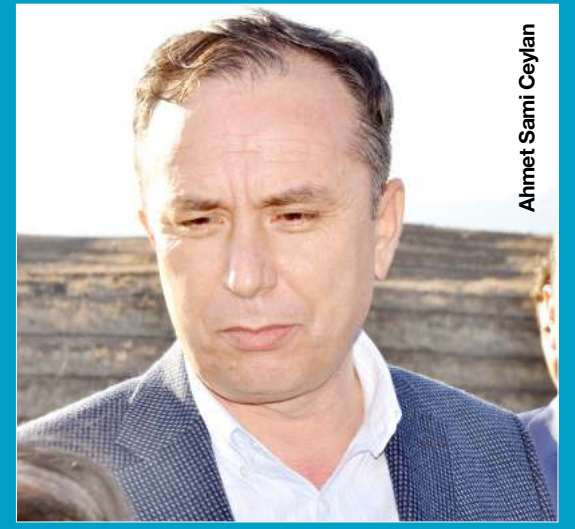
Ahmet Sami Ceylan

Hitit Üniversitesi'nin kuruluşunun 10. Yılı münasebetiyle oluşturulan hatıra ormanında gerçekleştirilen fidan dikim törenine katılan AK Parti Milletvekili Ahmet Sami Ceylan, Türkiye gündemini değerlendirerek, "Hiçbir parti, hiçbir partinin ağabeyliğini yapmasın. Her parti kendinden mesuldür" dedi. "Seçimle gelen seçimle gider" cümlesini 14 yıl önce AK Parti'nin söylediğini yineleyen Ceylan, HDP'nin seçim ile meclise girmesinin terör örgütü PKK'yı desteklediği gerçeğini değiştirmeyeceğini vurguladı. 4'DE