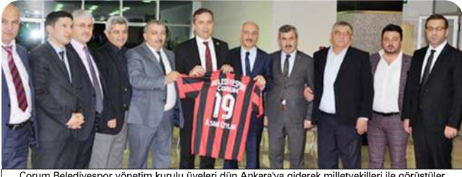
Çorum Belediyespor yönetim kurulu üyeleri dün Ankara'ya giderek milletvekilleri ile görüşüler.