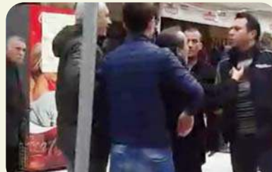
Yeni düzenleme en çokta, bölünen yol güzergâhlarında faaliyet gösteren esnafı etkiledi.

engelleyecek şekilde yapılan düzenleme trafik akışını bir nebze olsun rahatlattı, esnaf ise mağdur etti. Yeni düzenleme en çokta, bölünen yol güzergâhlarında faaliyet gösteren esnafı etkiledi. İşyerlerine mal getiren araçların park edememesi veya park ettiği zaman trafiğin tıkanması nedeniyle tartışmalar yaşanıyor. Bu olaylardan birisi de Cemilbey caddesinde meydana geldi. Bir işyerine mal indirmek isteyen araç yol kenarına park edince, trafik tıkanı. Araç sürücülerinin arasında gerginliğe neden olan olayı, bir başka esnaf ta cep telefonu ile görüntüledi. Basına servis edilen görüntüleri bir yandan cep telefonu ile geçen esnaf, seslendirme de yaparak, trafikteki yeni düzenlemeye tepki gösterdi. Öte yandan yol bölme çalışması yapılan güzergâhtaki esnaf sürücülerinin yol kenarına park edememesinin işlerini de olumsuz etkilediğini söylüyor.