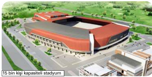
15 bin kişi kapasiteli stadyum