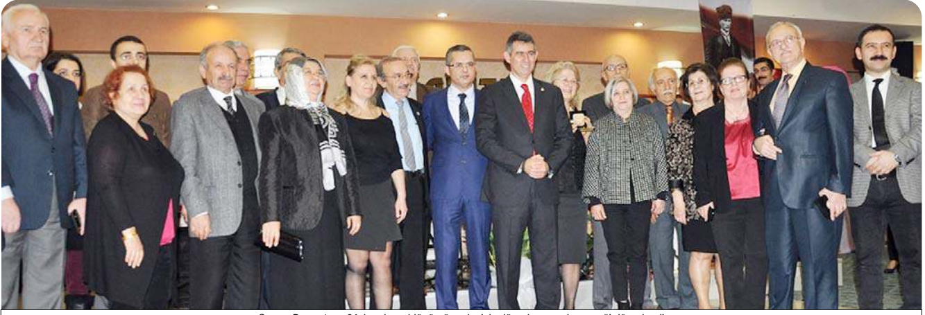
Çorum Barosu'nun 64. kuruluş yıldönümü nedeniyle düzenlenen gala yemeği düzenlendi