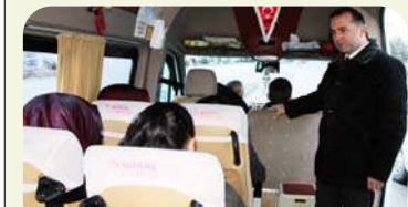
Sungurlu İlçe Milli Eğitim Müdürlüğü, öğrenci taşımacılığı yapan servis araçlarında denetimlerine devam ediyor.

Okullara da cuma namazı düzenlenmesi geldi. Milli Eğitim Bakanlığı isteyen yönetici, öğretmen ve diğer personele cuma namazı saatlerinde gerekli kolaylığın sağlanması için illere yazı gönderdi. Bakanlık tarafından 81 ilin milli eğitim müdürlüklerine gönderilen yazıda, cuma namazına ilişkin Başbakanlık genelgesinin Resmi Gazete'de yayımlanarak yürürlüğe girdiği anımsatıldı. Yazıda, Bakanlığa bağlı her tür ve seviye-