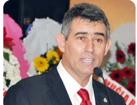
Türkiye Barolar Birliği Başkanı Metin Feyzioğlu

"Türkiye Barolar Birliğinin son üç yılda önemli çalışmalara imza attığını ifade eden Feyzioğlu, "Çorum Barosu'nun sosyal tesisini inşa etmek ve açmak bize nasip oldu. Artık daha güçlüyüz. Başımız eskisinden de dik. Çorum Barosu'nun ve bütün baroların büyük desteği ile Türkiye Barolar Birliği son üç yılda dünyada emsali görülmemiş ve bir numara diye işaretlenen inanılmaz bir sosyal güvenlik korumasını sağlamaya başlamıştır. 150 hastaneye, hemen hemen bütün