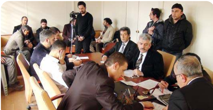
Çevreyoluna yapılması planlanan 15 bin kişi kapasiteli stadyum projenin yapım işinin ihalesi yapıldı