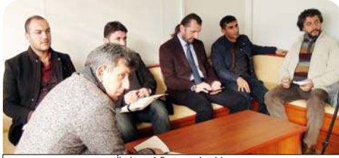
İhaleye 4 firmanın katıldı.

Çevreyoluna yapılması planlanan 15 bin kişi kapasiteli stadyum projenin yapım işini ihalesi, Belediye İhale Salonunda gerçekleştirildi. Fikret Karacaköylü başkanlığında yapılan ihale tapalı zarf usulü gerçekleştirildi. 4 firmanın katıldığı ihalede, en düşük teklifi 50 Milyon 900 bin lira ile Özen-El İnşaat verirken, ikinci düşük teklif 59 Milyon 900 bin lira, Çakır İnşaat'tan geldi. İhalede Alke İnşaat-Güneşyol İnşaat iş ortaklığı 62 Milyon 888 bin lira, Nuhoglu İnşaat-Dalgıçlar İnşaat iş ortaklığı ise 76 milyon 900 bin lira teklif verdi. İhale komisyonu başkanı Fikret Karacaköylü yaklaşık maliyeti 66 Milyon 953 bin lira olan stadyum inşaatı ihalesinde firmalar tarafından verilen teklif dosyalarının incelenerek önümüzdeki günlerde kararın açıklanacağını bildirdi. (Haluk SÖYLEMEZ)