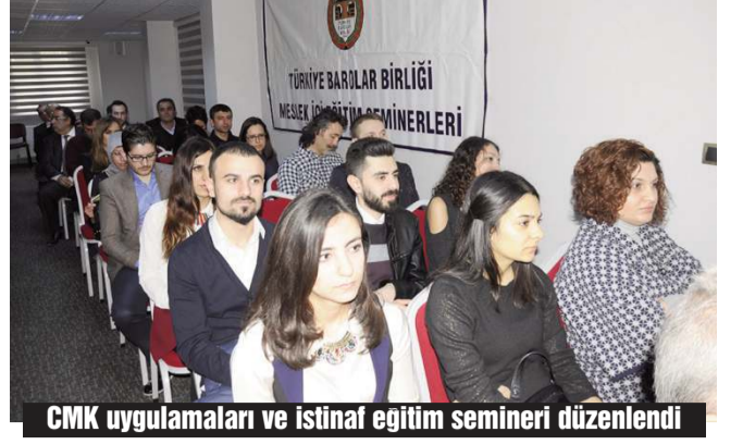
CMK uygulamaları ve istinaf eğitim semineri düzenlendi