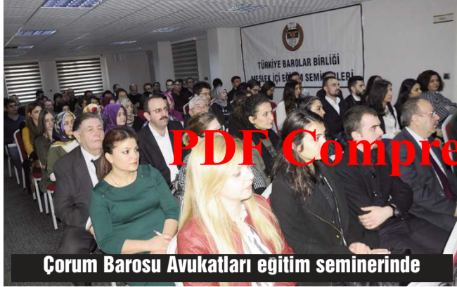
Çorum Barosu Avukatları eğitim seminerinde