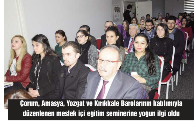
Çorum, Amasya, Yozgat ve Kırıkkale Barolarının katılımıyla düzenlenen meslek içi eğitim seminerine yoğun ilgi oldu