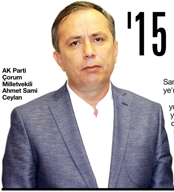
AK Parti Çorum Milletvekili Ahmet Sami Ceylan