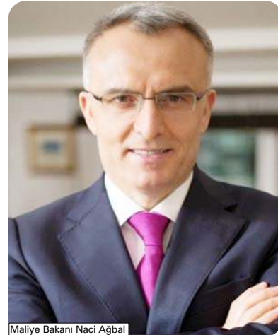
Maliye Bakanı Naci Ağbal

Maliye Bakanı Naci Ağbal, 2015 yılı Merkezi Yönetim Bütçe gerçekleştirmelerini açıklarken kamuya yeni personel alınacağını söyledi. Ağbalın verdiği bilgiye göre, 2016 yılında kamu kurumlarına 97 bin yeni personel alınacak.