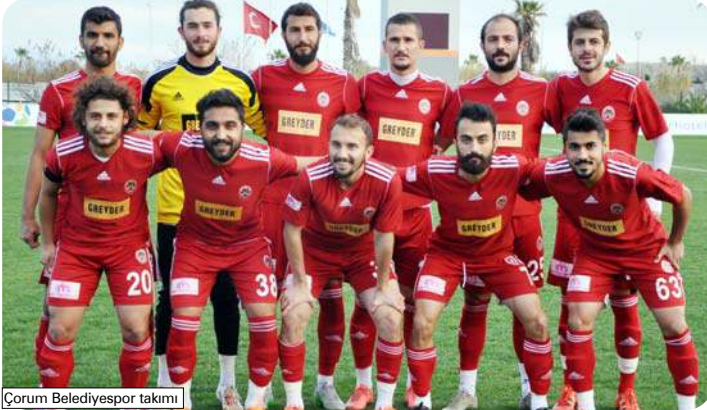
Çorum Belediyespor takımı