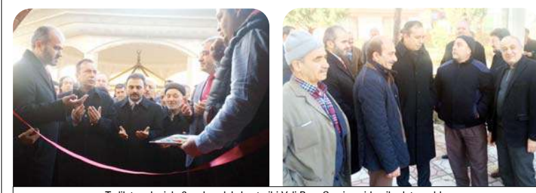
Tadilat nedeniyle 6 ay kapalı kalan tarihi Veli Paşa Camii yeniden ibadete açıldı.