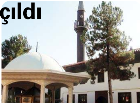
Gülábıbey mahallesinde Velipaşa camii adıyla bilinen Abdülbaki Paşa Camii'nde geçen yıl başlatılan restorasyon çalışmaları tamamlandı.

Tadilat nedeniyle 6 ay kapalı kalan tarihi Veli Paşa Camii yeniden ibadete açıldı. Cum anamızı öncesi dualarla açılış yapılan Velipaşa Camii, uzun aradan sonra yeniden cemaatle buluştu. Caminin açılış törenine Ak Parti Çorum Milletvekili Ahmet Sami Ceylan'da katıldı. Gülábıbey mahallesinde Velipaşa camii adıyla bilinen Abdülbaki Paşa Camii'nde geçen yıl başlatılan restorasyon çalışmaları tamamlandı. Tokat Vakıflar Bölge Müdürlüğü kontrolünde yapılan çalışmalar kapsamında 17. yüzyılda yapıldığı tahmin edilen tarihi caminin iç, dış, çatı ve minaresi, astı-na uygun bir şekilde yenilendi. Namaz öncesinde dua edilerek kurdele kesildi. Açılışın ardından kılınan Cuma namazı ile Veli Paşa camii'nde ibadet yeniden başladı. (Haluk SÖYLEMEZ)