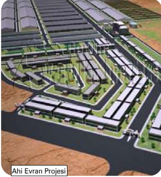
Ahi Evran Projesi

2015 yılında iş yeri kaydında görülen artışın en önemli nedeni, Çesob tarafından esnafa ya-