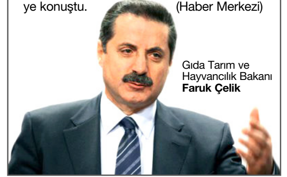
Gıda Tarım ve Hayvancılık Bakanı Faruk Çelik

Bakan Faruk Çelik küçükbaş hayvancılık hakkında da konuştu. belirlenen bölgelerde meralar çobanlara verilecek dedi. "meralarda bir vatandaş hayvancılık yapacaksa alacağı hayvan başına yüzde 30 destek veriyoruz meraları da üreticiye tahsis ediyoruz" diye konuştu. (Haber Merkezi)