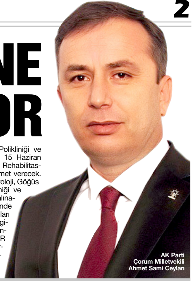
AK Parti Çorum Milletvekili Ahmet Sami Ceylan

Hastalıkları, KBB ve Göz Polikliniği ve servisleri devreye alınacak. 15 Haziran 2017 tarihinde Fizik Tedavi Rehabilitasyon Polikliniği ve servisi hizmet verecek. 19 Haziran 2017 tarihinde Üroloji, Göğüs Hastalıkları, Nöroloji Polikliniği ve taşkıma merkezi hizmete alınacak. 26 Haziran 2017 tarihinde Dahiliye ve Çocuk Hastalıkları Polikliniği ve servisi hizmete girecek. 3 Temmuz 2017 tarihinde Ortopedi Polikliniği, MR Ünitesi ve yoğun bakım servisleri tedavi hizmetine başlayacak." (Haber Merkezi)