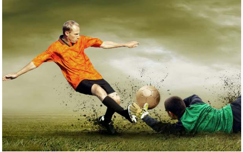
Off'a kalan takım Darıca G.B olacak. Bu arada Darıca GB'nin bu hafta sahasında Erzincan'ı yenmesi gerekecek.

Kritik maç berabere bitip, Darıca G.B de Erzincanspor'u eli boş gönderirse, hesaplar son haftaya kalacak. Çorum Belediyespor sahasında İskenderunspor'u yener, Beylerbeyispor da Erzincanspor deplasmanından en az 1 puanla dönerse, Darıca G.B son hafta deplasmanda Bayburtspor'u yense dahi Play-Off yarışında saf dışı kalacak ve Beylerbeyispor ile Çorum Belediyespor Play-Off'a kalan takımlar olacak. Ligde 57 puanla 3.sıradaki bulunan Bayburt G.Ö.İ takımının dahi Play-Off'a giremeye durumu bulunuyor. Bayburt GÖİ takımın son maçta evinde Gölcükspor'a 1-2'lik skorla yenilip Play-Off işini tehlikeye attı. Bayburt ekibi bu hafta Niğde Belediyespor deplasmanında puan kaybı yaşar, son hafta da kendi sahasında Darıca G.B'ye kaybederse Play-