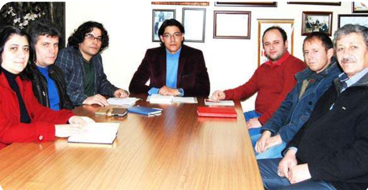
Demokrat Eğitimciler Sendikası Çorum Teşkilatı aylık olağan toplantısını yaptı.