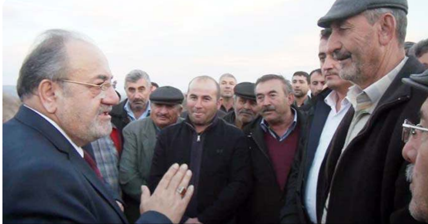
Çukurköylüler Ak Parti Çorum Milletvekili Salim Uslu'nun yolunun kesti.

Osmancık Belediyesi şehir içi trafiğini rahatlatmak için çalışmalar hızlandırdı. İlçe merkezinde özellikle iş merkezlerinin yoğun olduğu bölgelerde otopark sayısını artıran belediye vatandaşların araçlarını cadde kenarları, sokak araları ve okul önlerine park etmek yerine hemen bir adım yakında bulunan otoparkları tercih etmelerini etkin çalışmalarda bulunuyor. Son olarak Atatürk Ortaokulu önündeki otopark yaşağına uymayan sürücüler için önlem alan Osmancık Belediyesi'nden vatandaşların okulun Kuzey batı kısmında yer alan Hıdırlık otoparkı ile yine okul karşısında bulunan Konak otoparkının kullanılmasının önemi belirtildi. Okul önünde kaldırma çıkarmak suretiyle park yapan araçların hem yaya trafiğini olumsuz yönde etkilediği hem de okul giriş ve çıkış saatlerinde öğrencilere engel olduğunu belirten yetkililer, vatandaşların bu şekilde araç park etmek yerine 40-50 metre mesafedeki Hıdırlık ve Konak otoparklarını tercih etmelerinin önemine değindi. (Haber Merkezi)