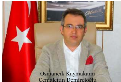
Osmancık Kaymakamı Cemalettin Demircioğlu