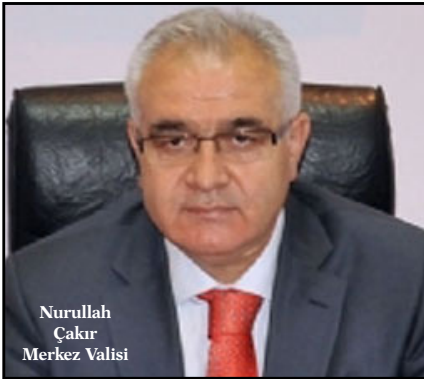
Nurullah Çakır Merkez Valisi

Darbe girişiminin bastırılmasının ardından ülke genelinde 246 idare amiri açığa alındı. 2010 - 2012 arası Çorum Valiliği yapan Nurullah Çakır, 2012 - 2014 yılları arasında Çorum Valisi olan Sabri Başköy ve 1992 - 1995 yılları arasında Ortaköy Kaymakamlığı yapan Merkez Valisi Yılmaz Arslan da açığa alınan mülki idare amirleri arasında bulunuyor. Gezi olayları sırasında İstanbul Valiliği yapan Merkez Valisi Hüseyin Avni Mutlu da açığa alındı.